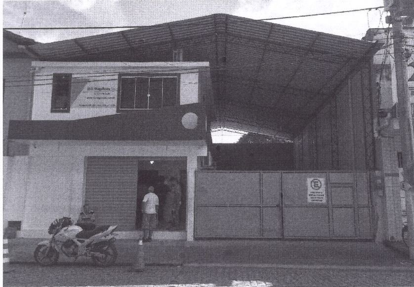
Figura 1: Vista da fachada da área a ser desempenhada a atividade.