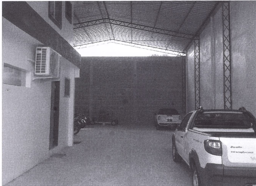
Figura 2: Local a ser desempenhada a atividade.