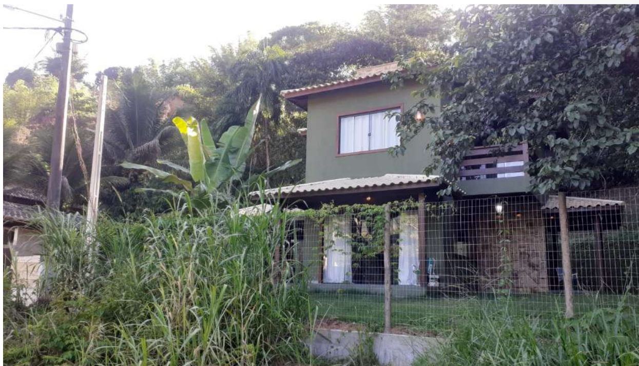
FIGURA 2: Registro fotográfico da vistoria.