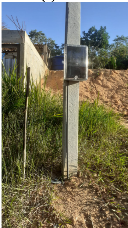
FIGURA 2: Registro fotográfico da vistoria.