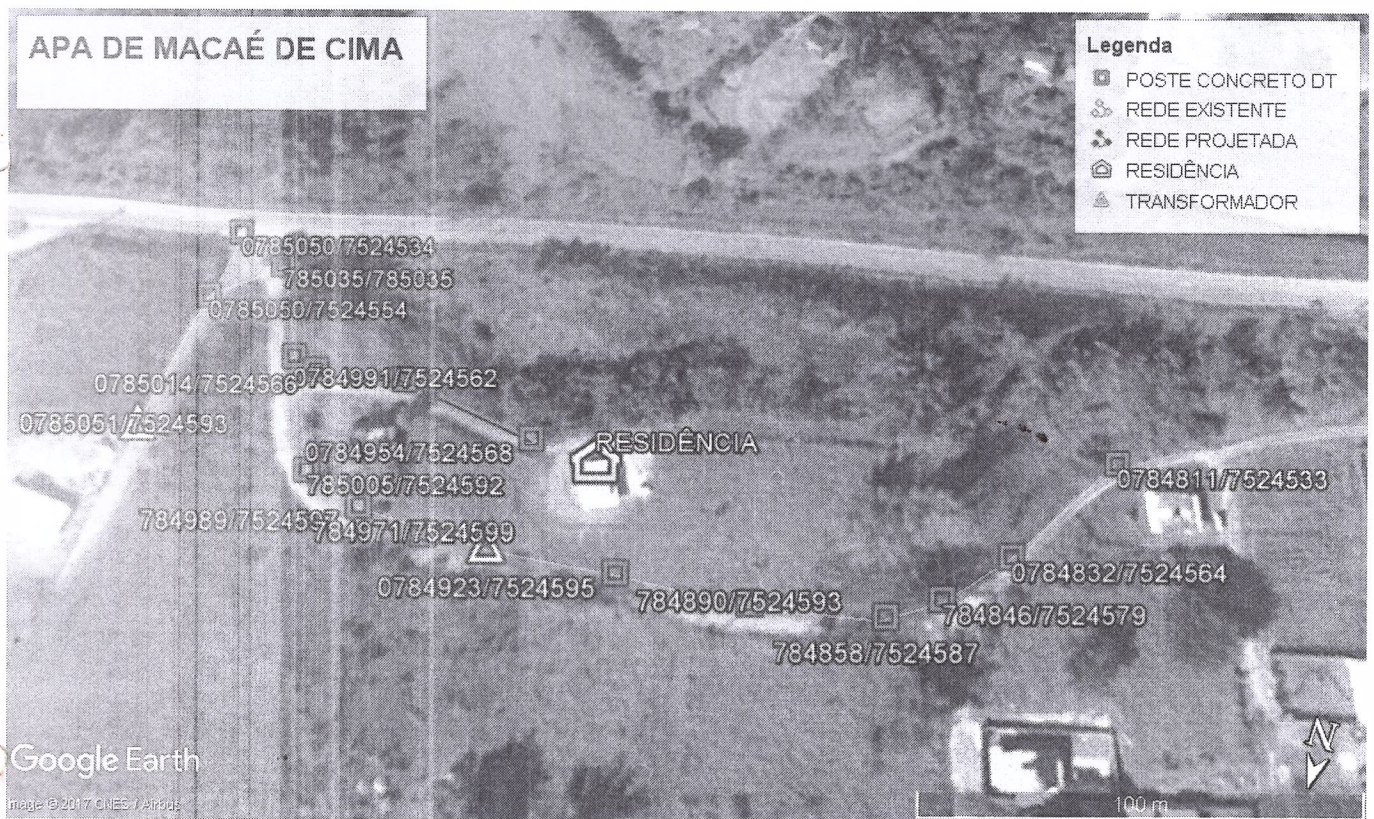
Figura 1: Vista aérea da área a ser implantada a ampliação da rede.

Na figura acima em destaque encontra-se delimitada a área a ser executado o empreendimento. Detalhe da linha já existente. Distanciamento do corpo hídrico da residência contemplada.