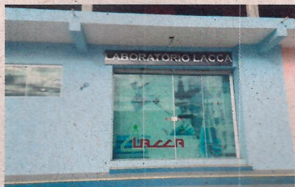
Fachada do Empreendimento