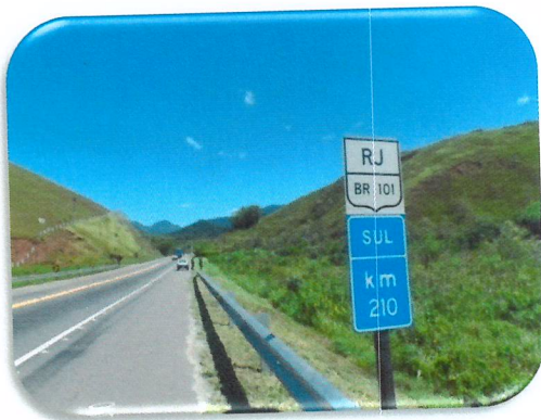
Área do empreendimento.