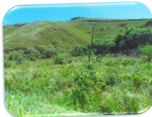
Vista sentido Rio de Janeiro e Campos, respectivamente.