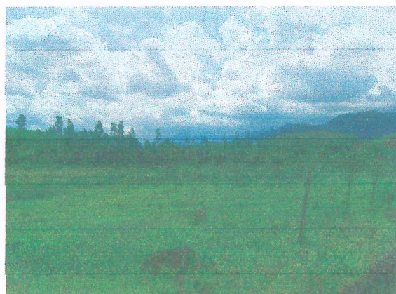
Área de Preservação Permanente pertencente ao empreendimento com metragem de 31.136,95 m²