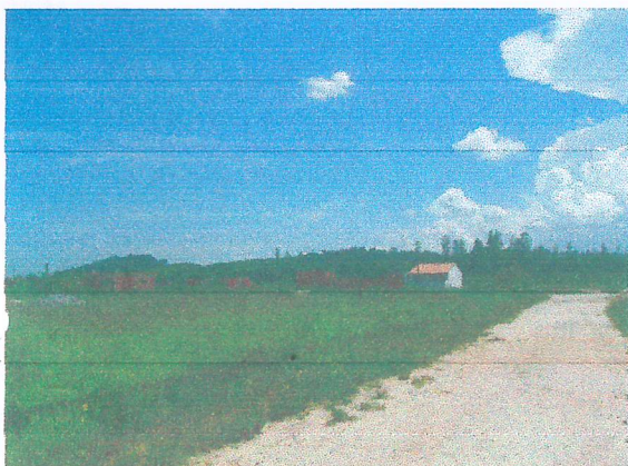
Ruas sem pavimentação e rede elétrica parcialmente implantada.