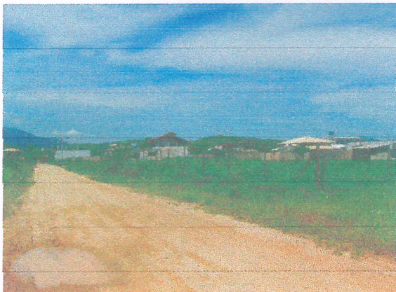
Vista da entrada principal do Loteamento São Sebastião (Rua Projetada 12).