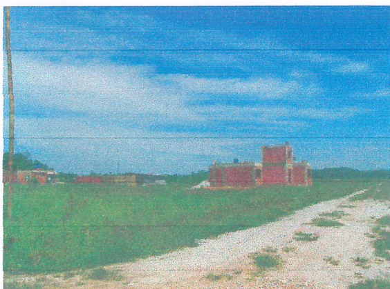
Casas em fase de construção e lotes sem ocupação.