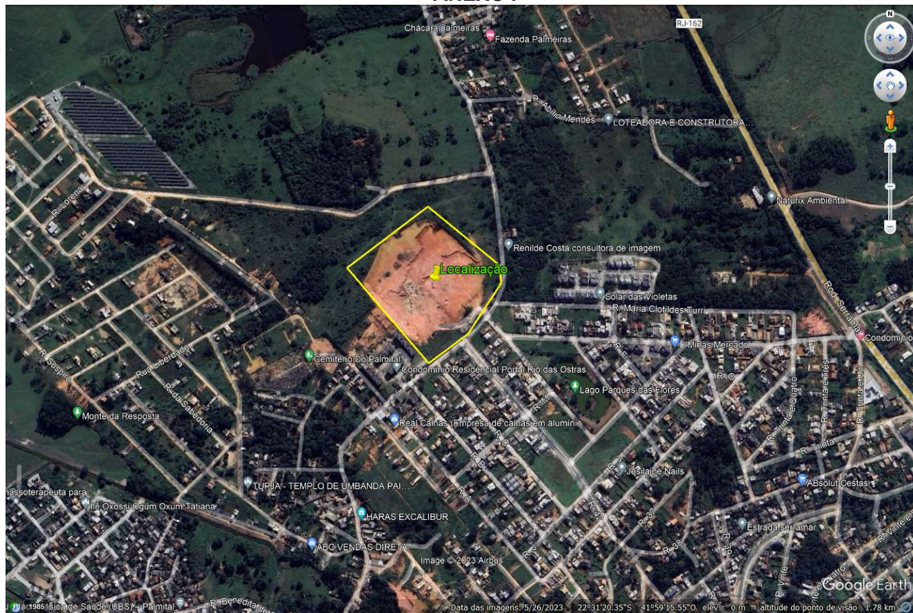
FIGURA 1: Localização da área.

A seguir é apresentado o registro fotográfico da vistoria realizada.