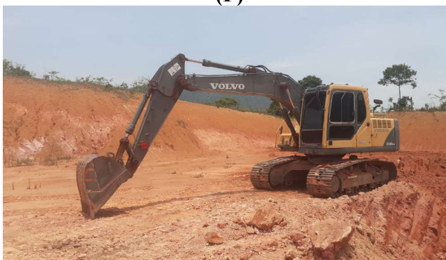
FIGURA 2: Registro fotográfico da vistoria.

Foi verificado que a atividade está ainda na fase de terraplanagem, sendo que, a extração mineral realizada é licenciada pelo INEA; ainda não sendo iniciada a construção das edificações que compõem a infraestrutura do condomínio. Não foi verificada nenhuma inconformidade na execução, estando dentro do previsto dos projetos anexados.