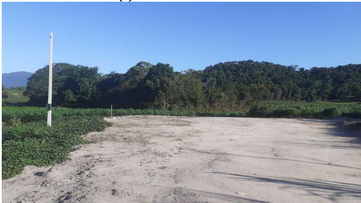
FIGURA 2: Registro fotográfico da vistoria.