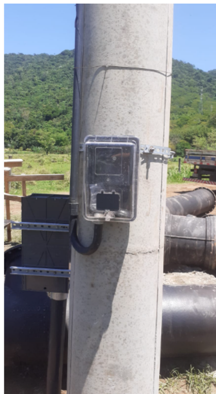
FIGURA 02: Registro da Vistoria.