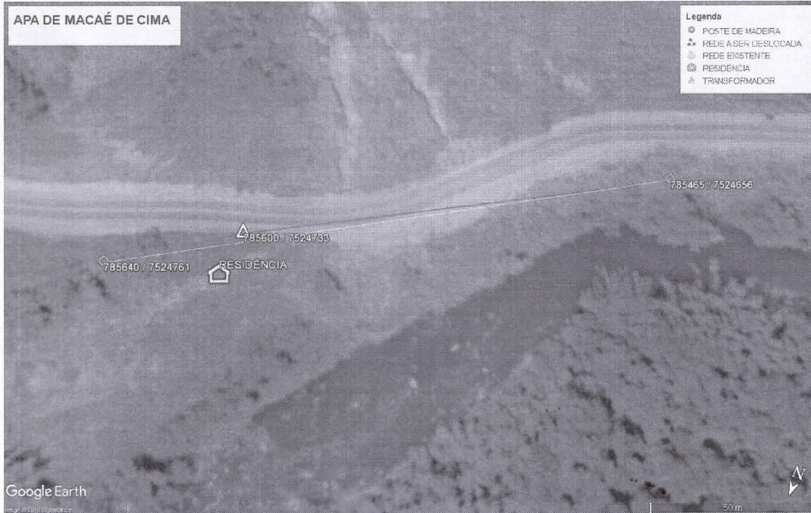
Figura 1: Vista aérea da área a ser Implanta a ampliação da rede.