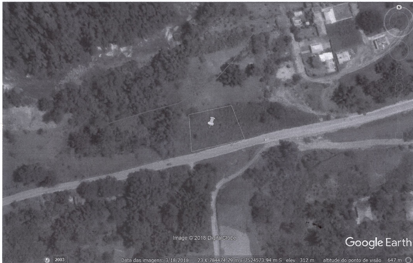
FIGURA 1: Localização da atividade em relação ao entorno.