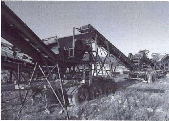
c) Máquina de processar entulho.