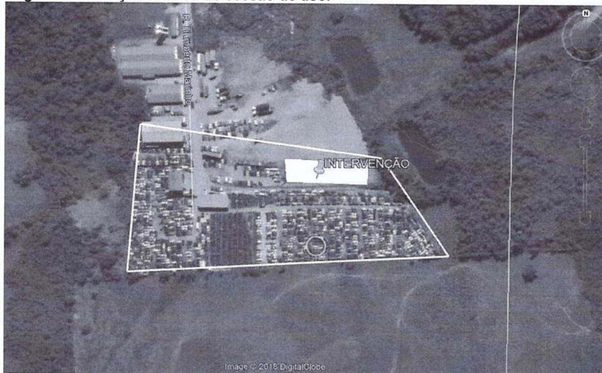
Figura 2: Área de intervenção e rede de drenagem natural.