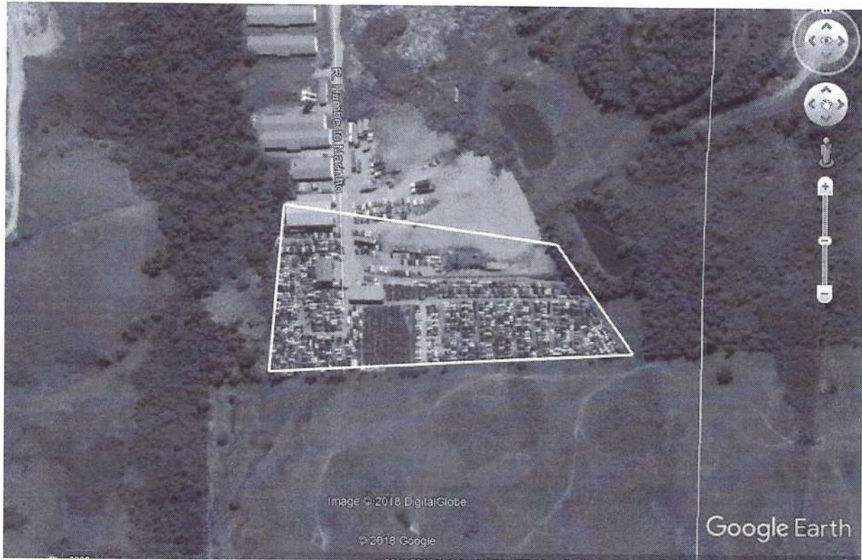
Figura 1: Definição da área de cessão de uso.