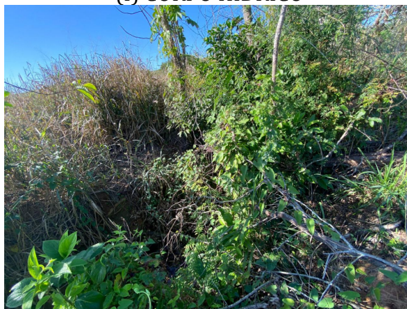
(I) CORPO HÍDRICO