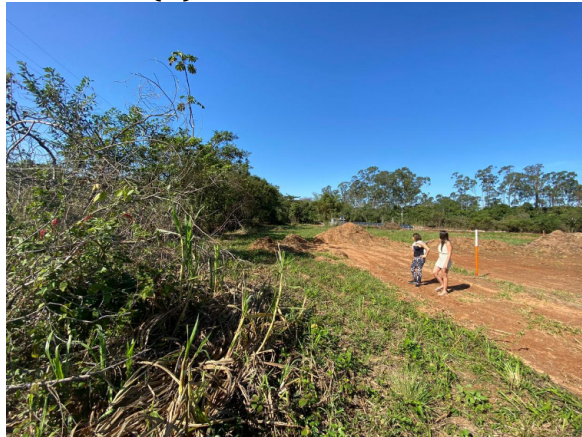
(D) VISTORIA DA APP