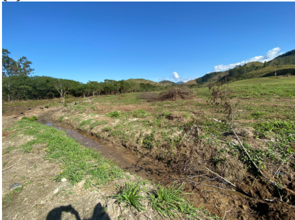
(E) CANALETA DE DRENAGEM EXISTENTE