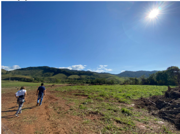
(C) VISTORIA DA ÁREA DE ATERRO