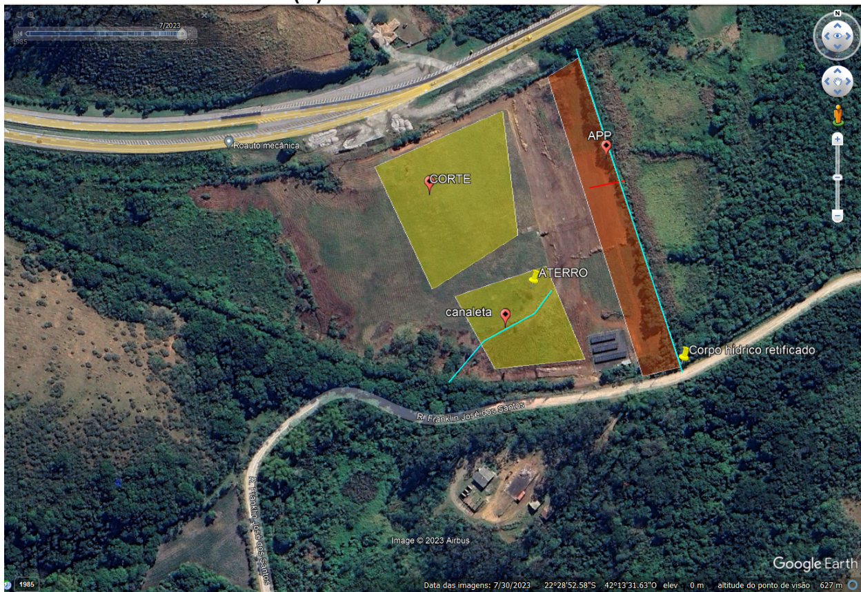
FIGURA 01: Localização do lote.