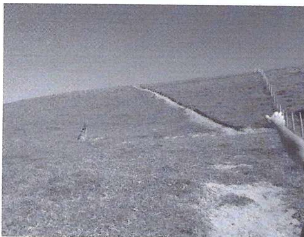
a) Vista da área da estrada.