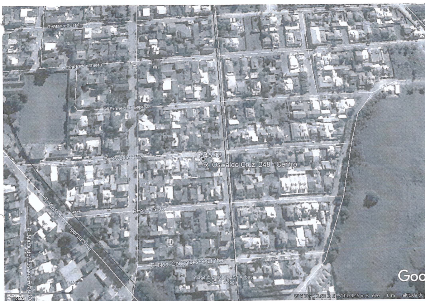
Figura 1:Localização, detalhe do entorno.