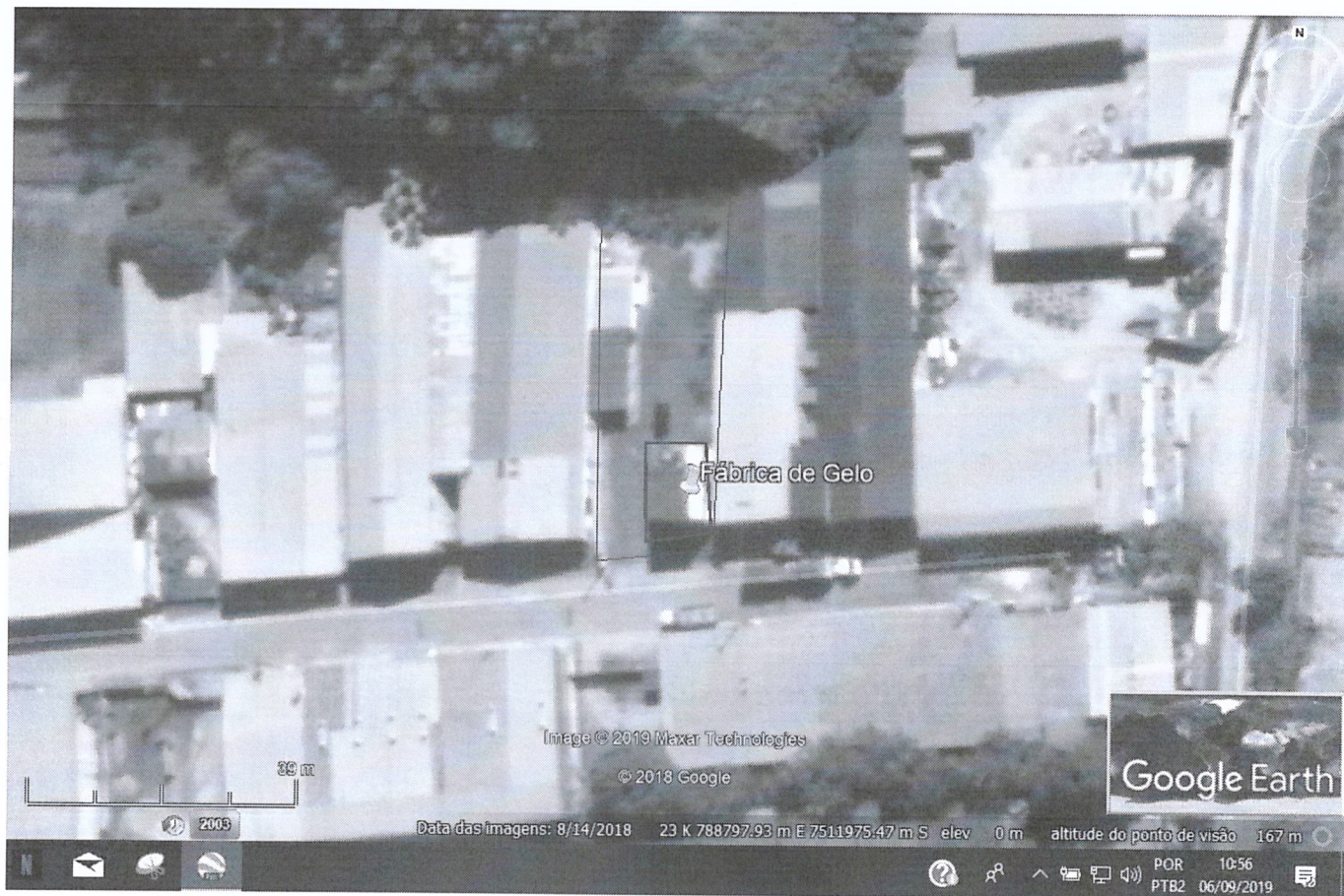
Figura 1: Localização do empreendimento.