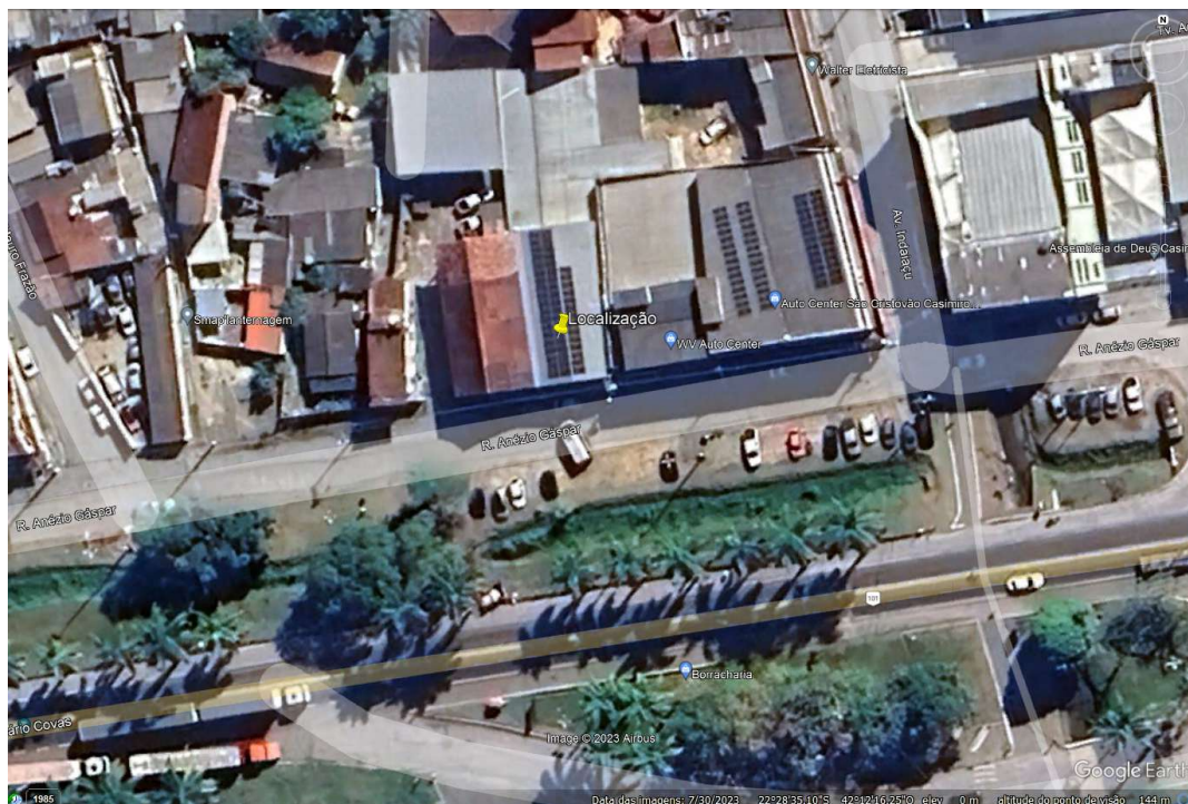
FIGURA 1: Localização, imagem obtida pelo Programa Google Earth.

A seguir é apresentado o registro fotográfico da vistoria realizada.