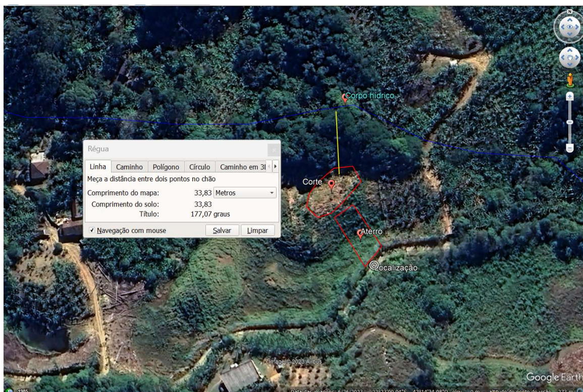
FIGURA 2: Descrição das intervenções em relação ao corpo hídrico mais próximo.