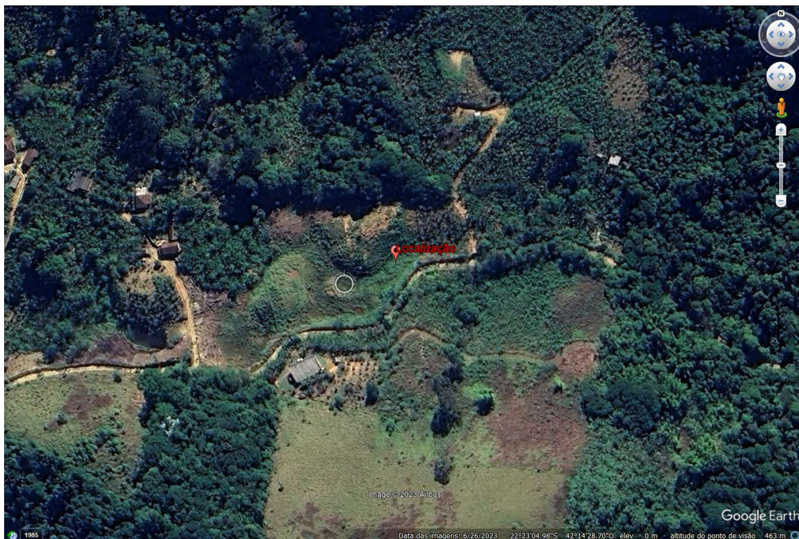
FIGURA 1: Localização da área de intervenção, imagem obtida pelo Programa Google Earth.