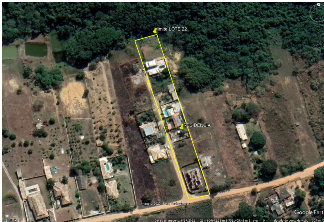
FIGURA 1: Localização da residência.

A seguir é apresentado o registro fotográfico da vistoria realizada.