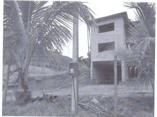
Figura 2: Fotos da Vistoria do local.

Vivian Pinto Bickel Vivian Pinto Bickel Departamento de Fiscalização Ambiental Matrícula nº 6253