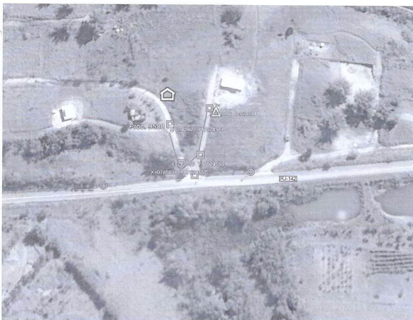
Figura 1: Vista aérea da área a ser implantada a ampliação da rede.