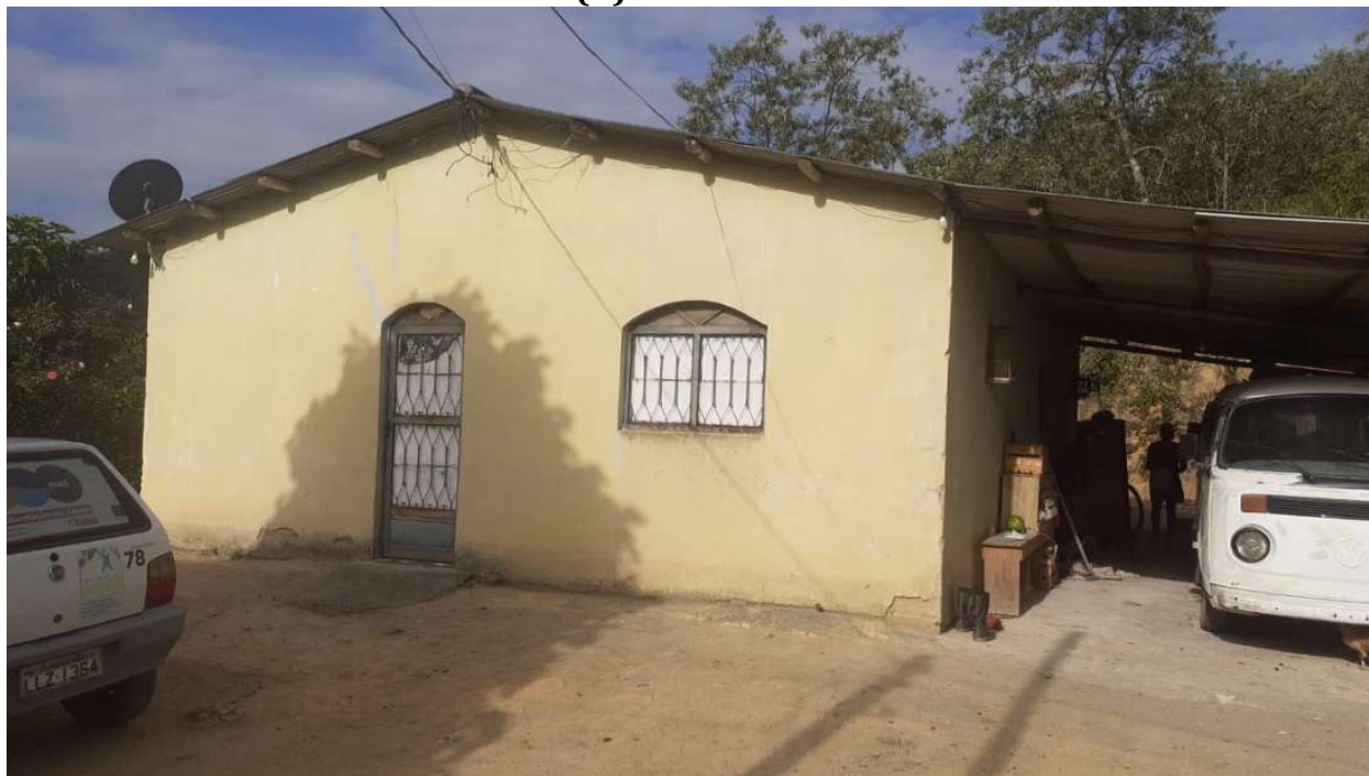
FIGURA 2: Registro fotográfico da vistoria.