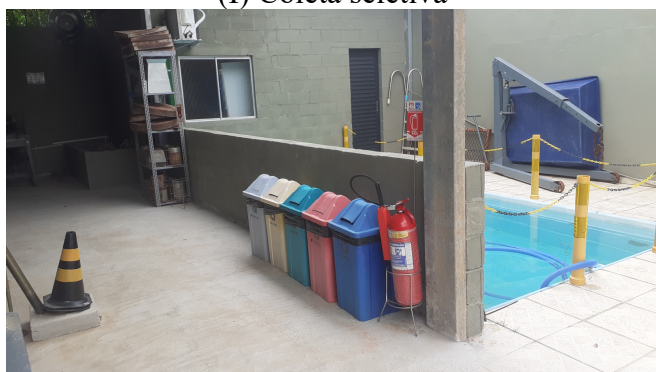
(I) Coleta seletiva