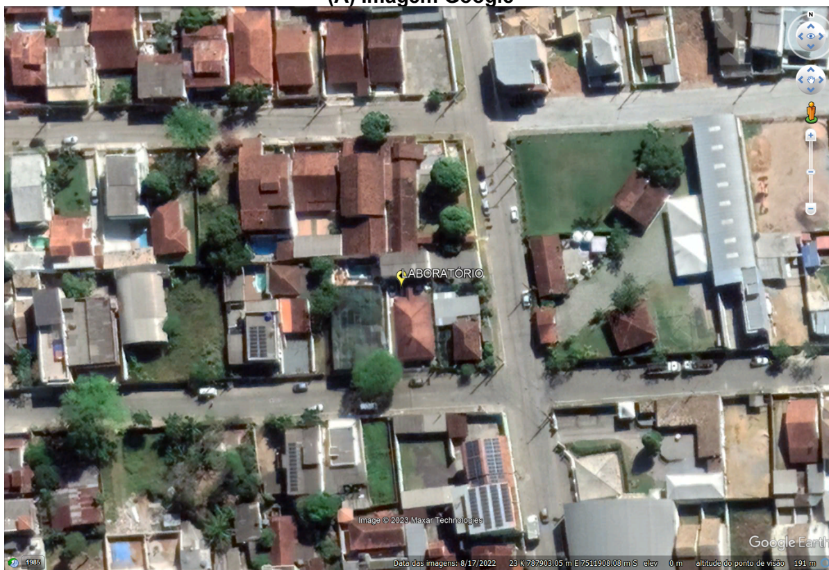
FIGURA 1: Localização do laboratório.

A figura 1 apresenta a localização do laboratório e a figura 2 o registro da vistoria.