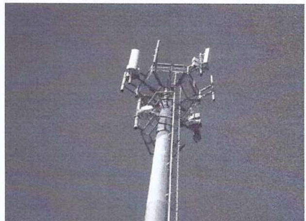
b) Detalhe da parte superior