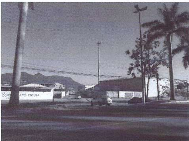
a) Vista Torre ao fundo