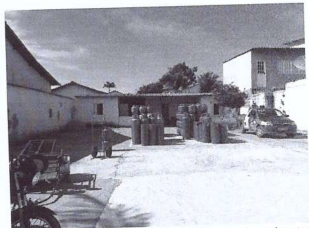
b) Vista da Área de depósito e circulação