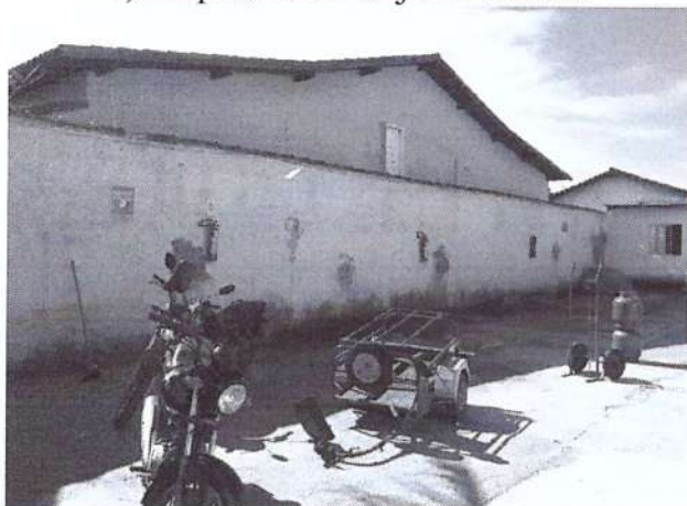
e) Veículo de entrega