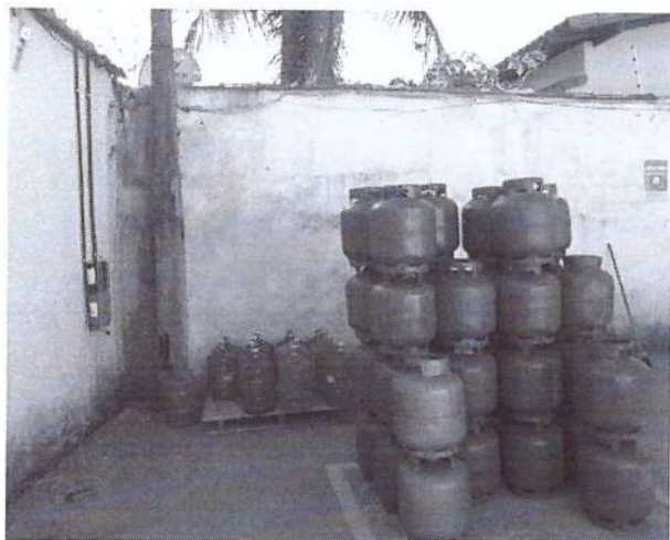
c) Depósito de bujões vazios.