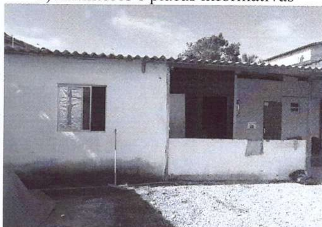
f) Administrativo e sanitários.