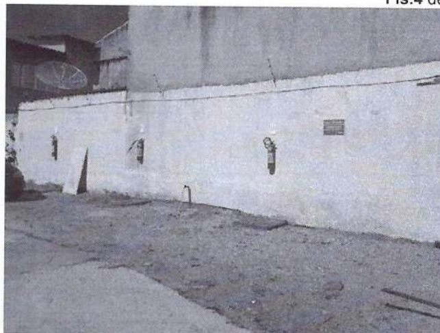
d) Extintores e placas informativas