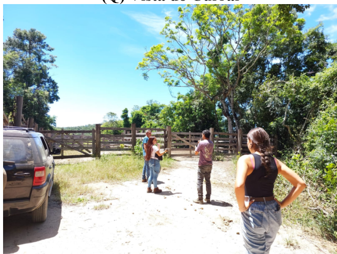
(Q) Vista do Curral