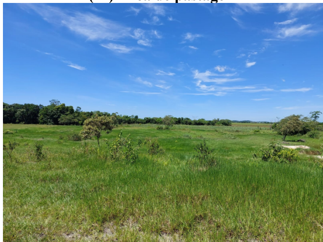
(M) Área de pastagem