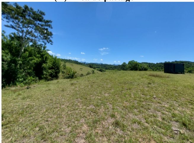
(A) Área de pastagem