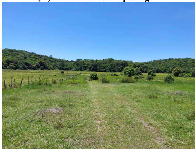
(D) Área de acesso e pastagem