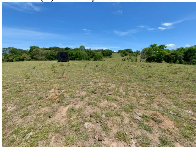
(G) Localização do container