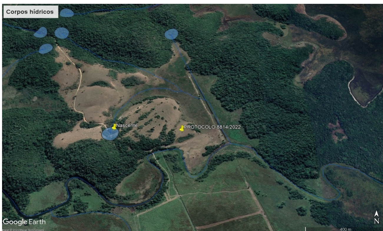
FIGURA 2: Descrição da rede de drenagem natural em relação a área de Intervenção, imagem obtida pelo Programa Google Earth .