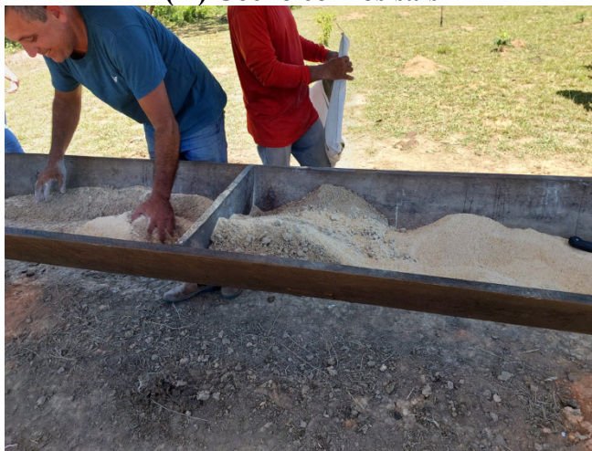
(H) Cocho com os sais