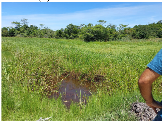
(K) Vista do “bebedouro”