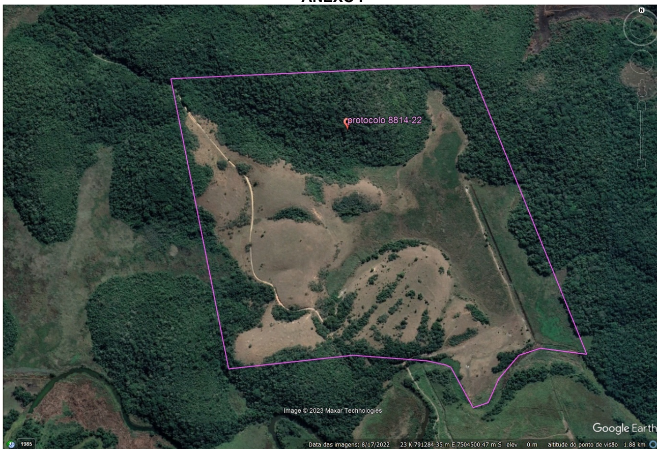
FIGURA 1: Localização da área de intervenção, imagem obtida pelo Programa Google Earth .