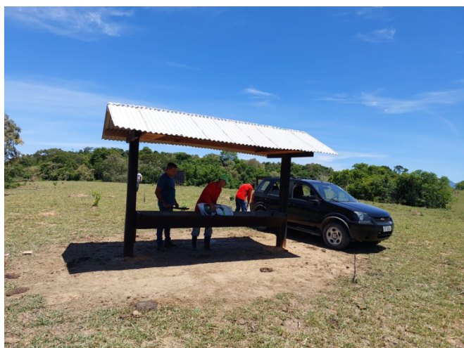
(I) Vista do Cocho