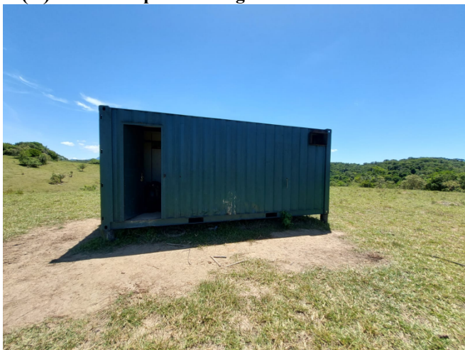
(E) Container para estocagem de materiais/alimento