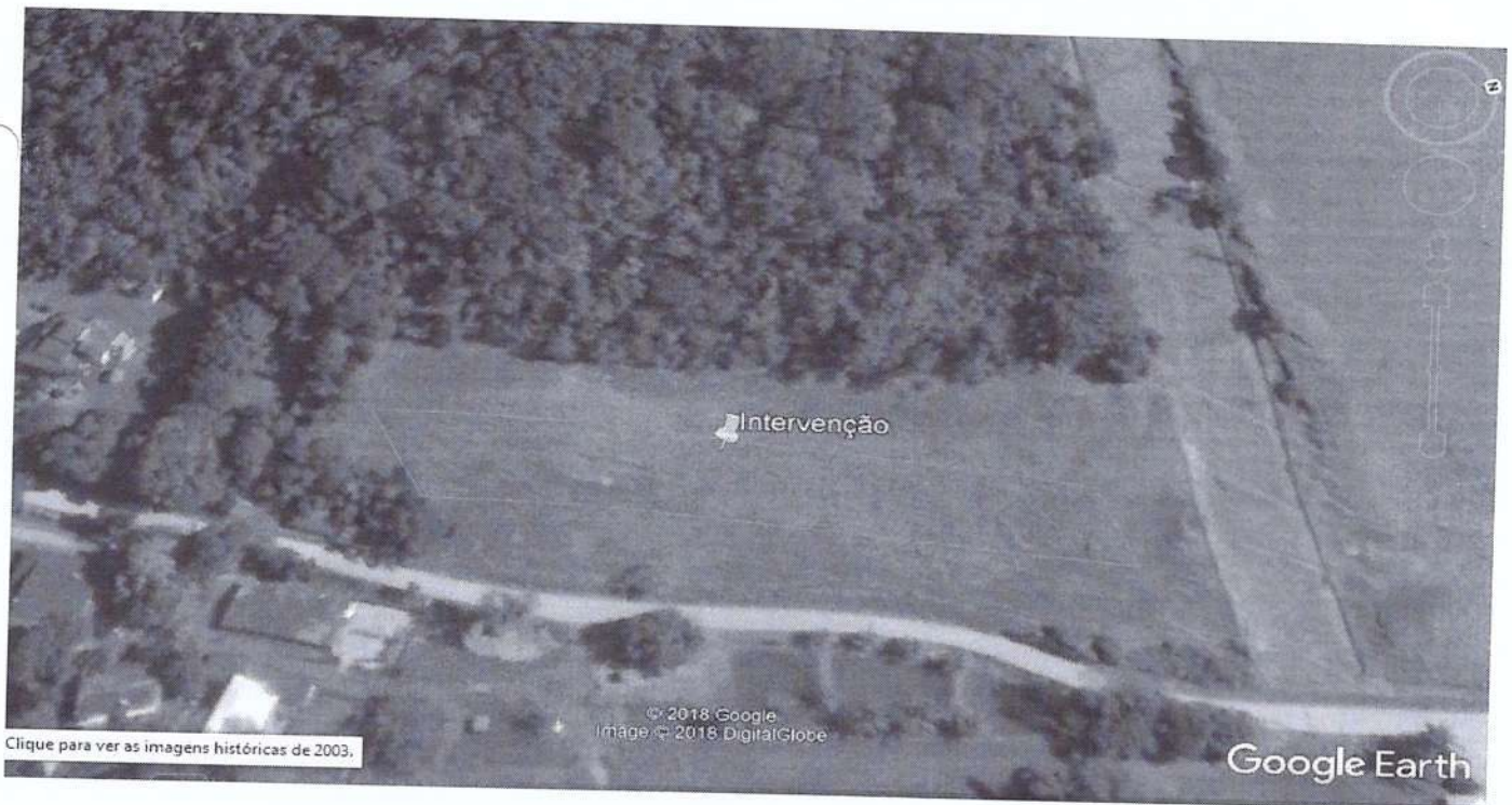
Figura 2: Área de desmonte e distância da rede de drenagem natural.