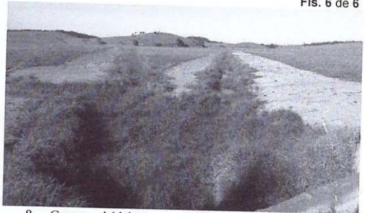
8. Corpo hídrico e APP interceptada. Ponte existente, intervenção apenas aérea.