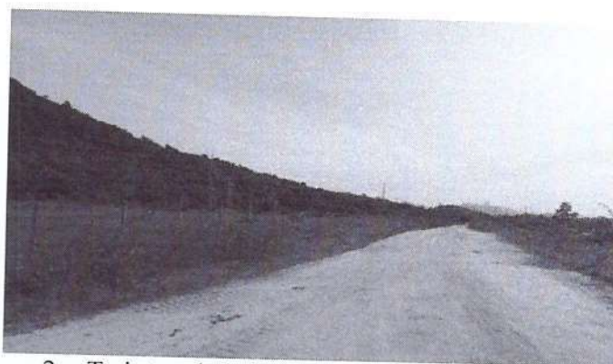
2. Trajeto pelo lado esquerdo.