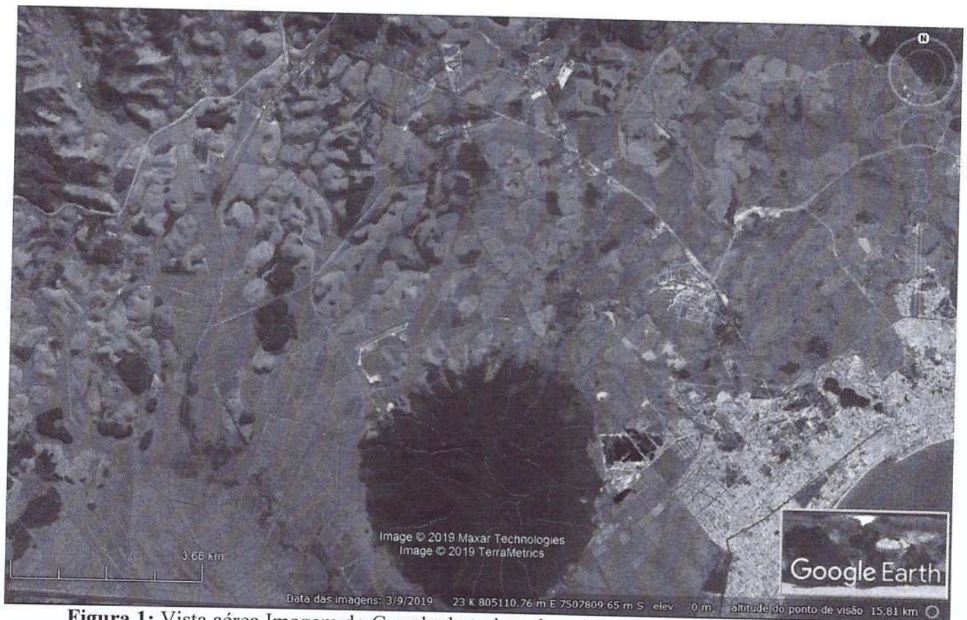
Figura 1: Vista aérea Imagem do Google do trajeto da rede.

A área a sofrer intervenção está inserida nos limites da APA da Bacia do Rio São João/Mico-leão-dourado.