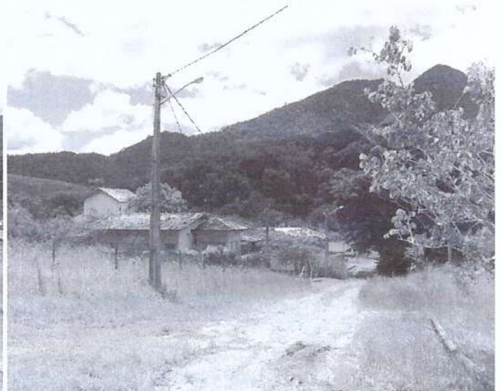
Figura 2: Fotos da Vistoria do local.

Vivian Pinto Bickel Vivian Pinto Bickel Departamento de Fiscalização Ambiental Matrícula nº 6253