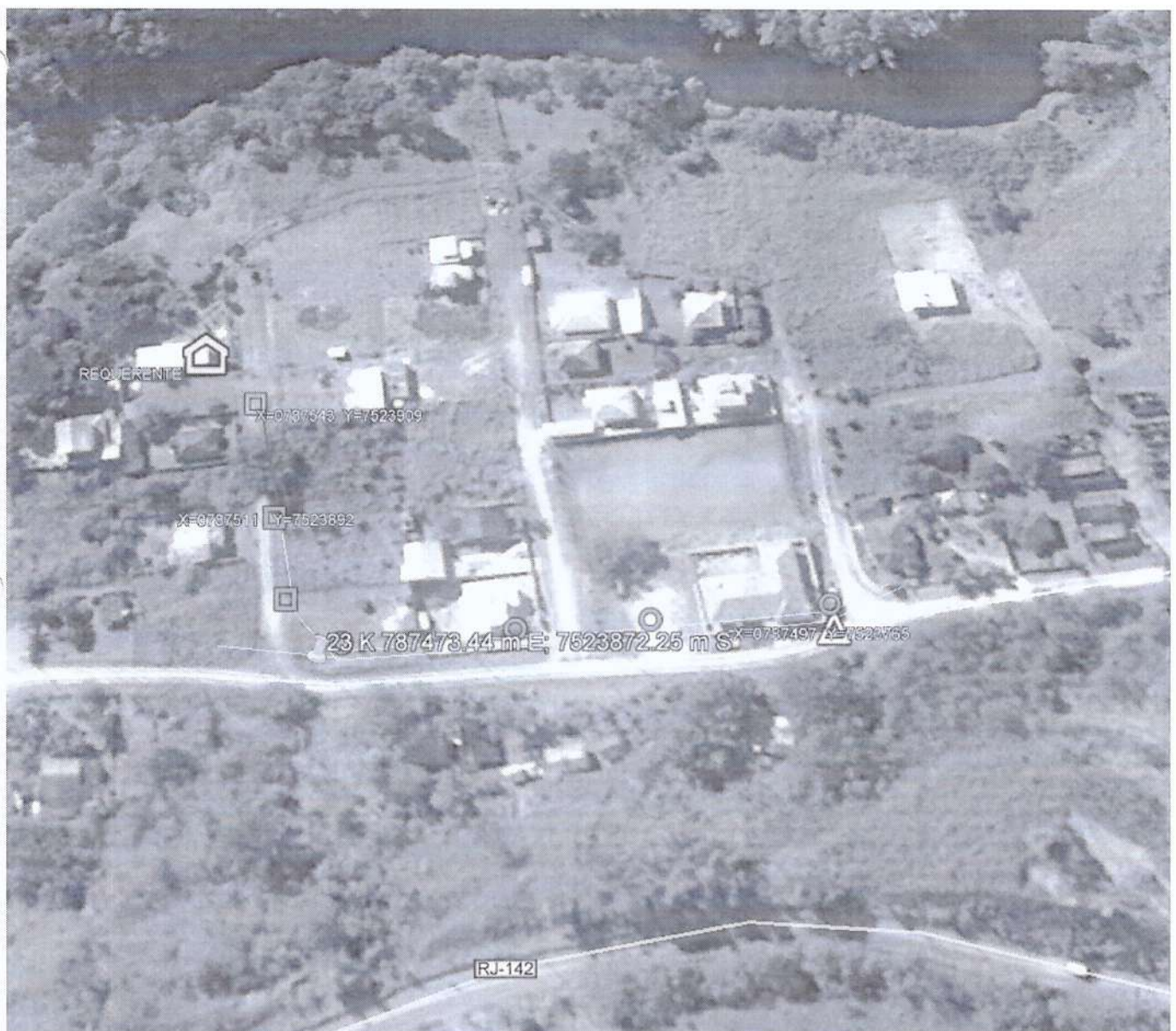
Figura 1: Vista aérea da área a ser implantada a ampliação da rede.