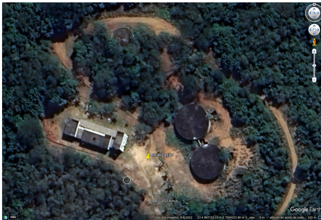
FIGURA 2: Imagem aproximada.