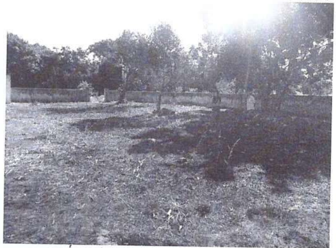
Área interna capela mortuária.