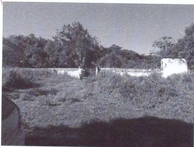
Vista da entrada do cemitério.