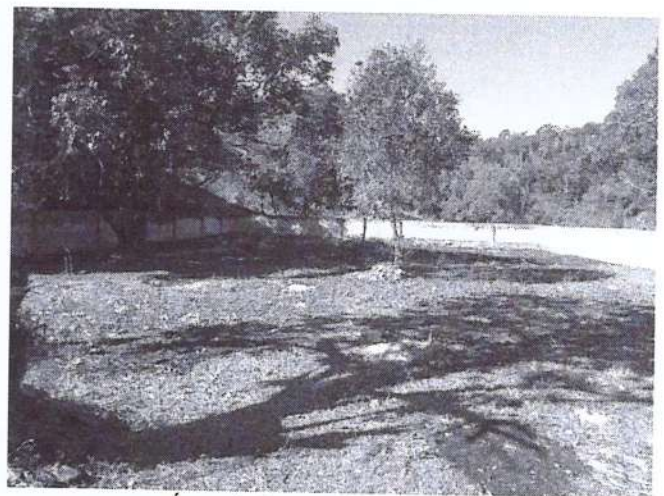
Área interna do cemitério.