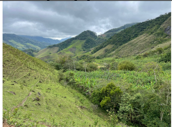
Imagem 3: Vegetação aparentemente localizada em vale.