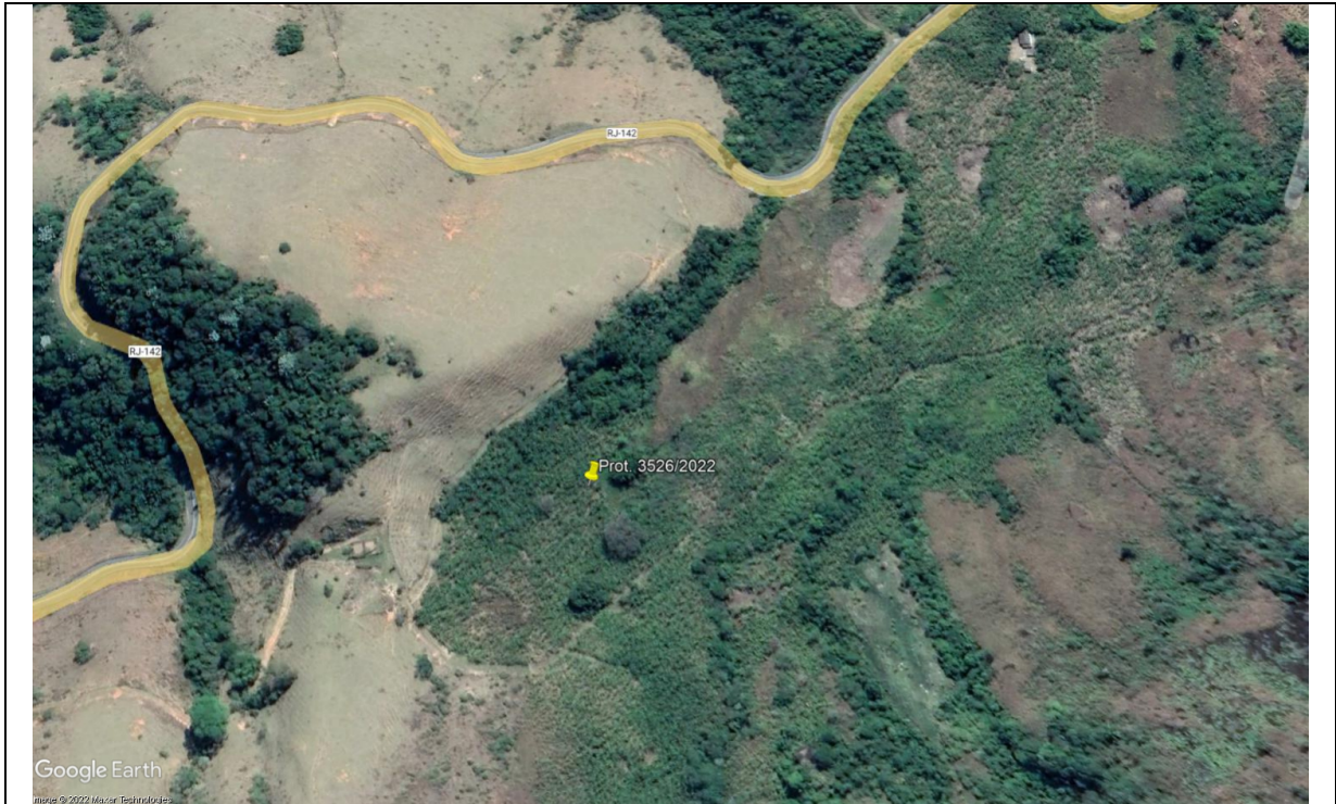
Imagem 1: Área da supressão vista de cima.