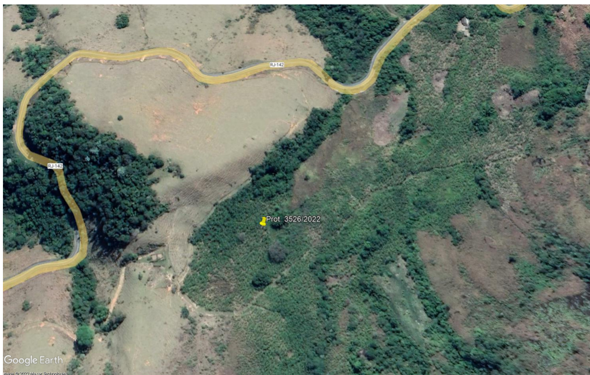
Imagem 1: Localização da propriedade marcada com auxílio do Google Earth.

Trata-se de requerimento de corte de exótica para formação de pasto.