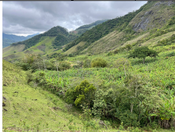
Imagem 2: Área da supressão, com bananeiras em maior número.