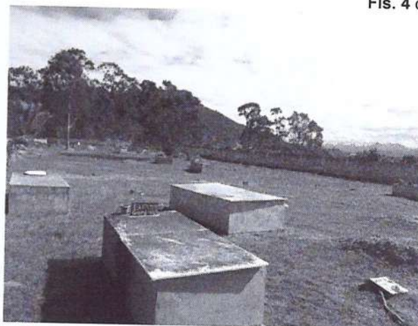
Área com menor concentração de jazigos.