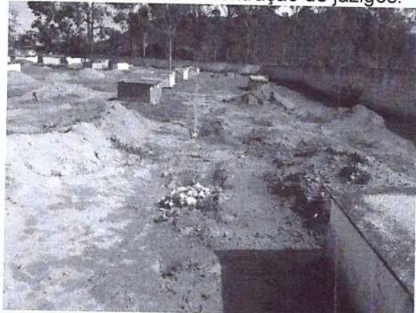
Área com manutenção precária