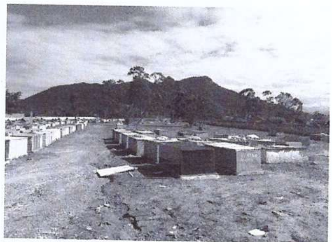
Vista da área interna.