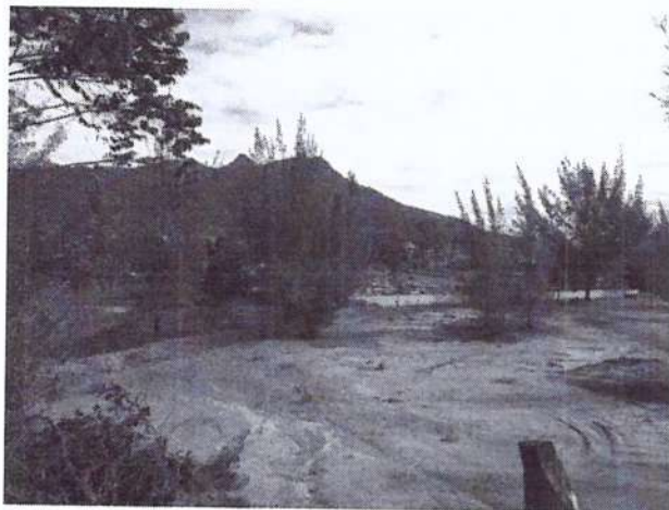
Vista do cemitério, área externa do cemitério.