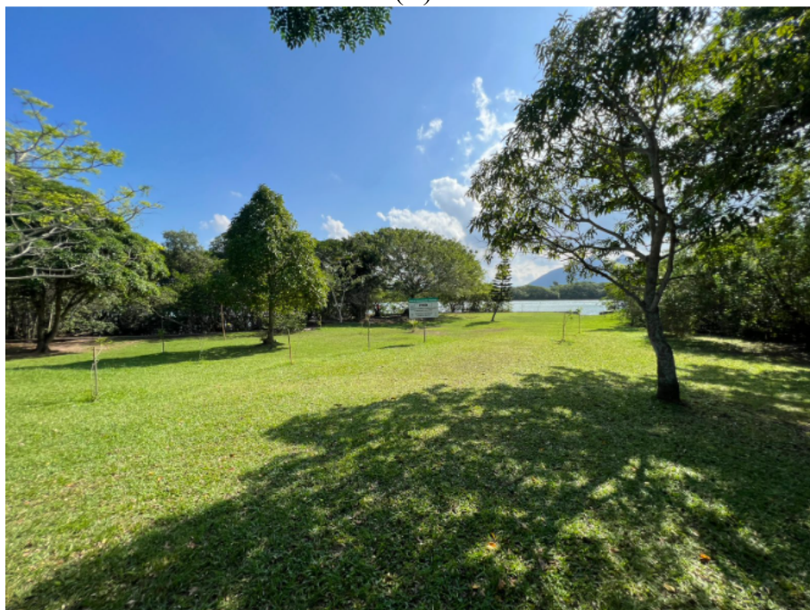
FIGURA 03: Registro fotográfico da área onde será instalado o parquinho.