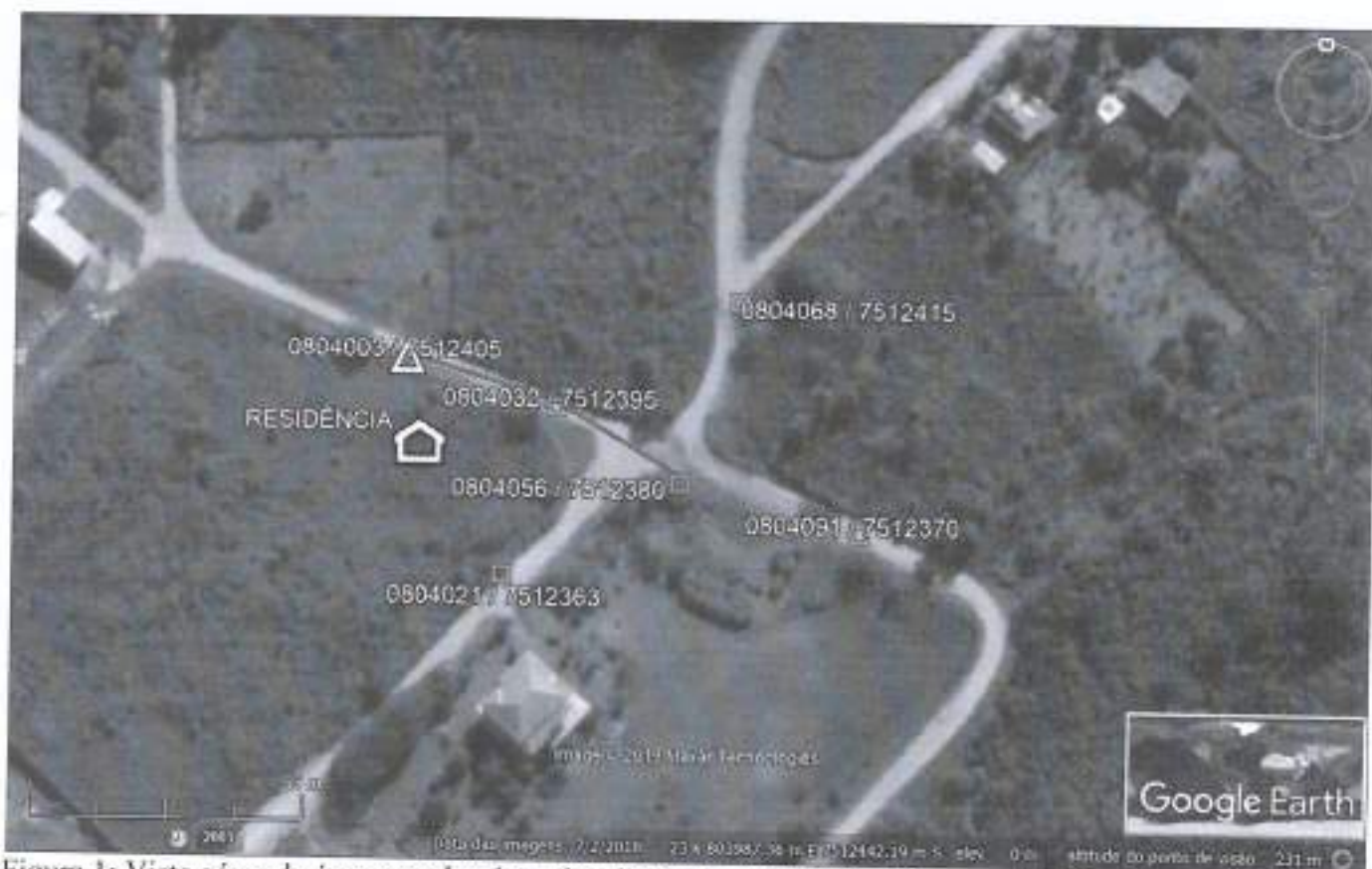
Figura 1: Vista aérea da área a ser implantada a linha de transmissão, futura rede delimitada em vermelho.

A área a sofrer intervenção está inserida nos limites da APA da Bacia do Rio São João/Mico-leão-dourado.