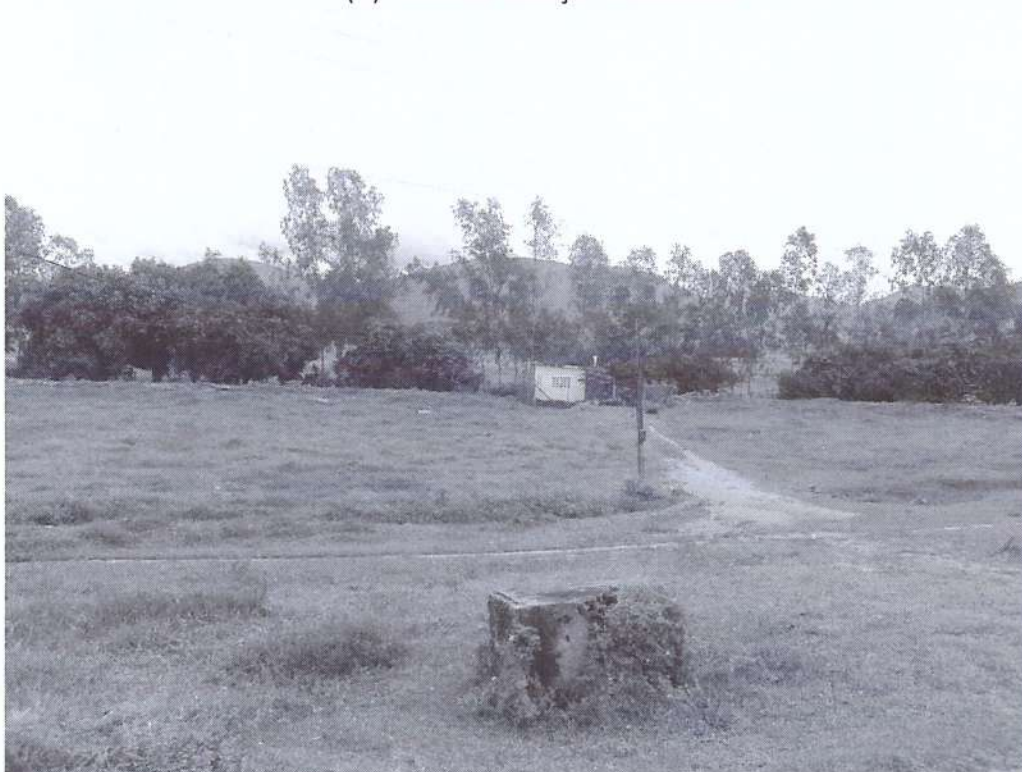
FIGURA 2: Fotos da Vistoria