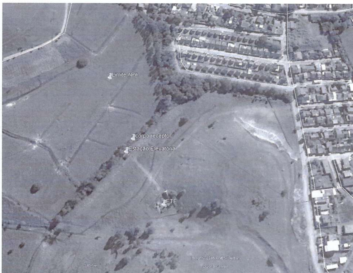
FIGURA 1: Localização da estação de Tratamento.