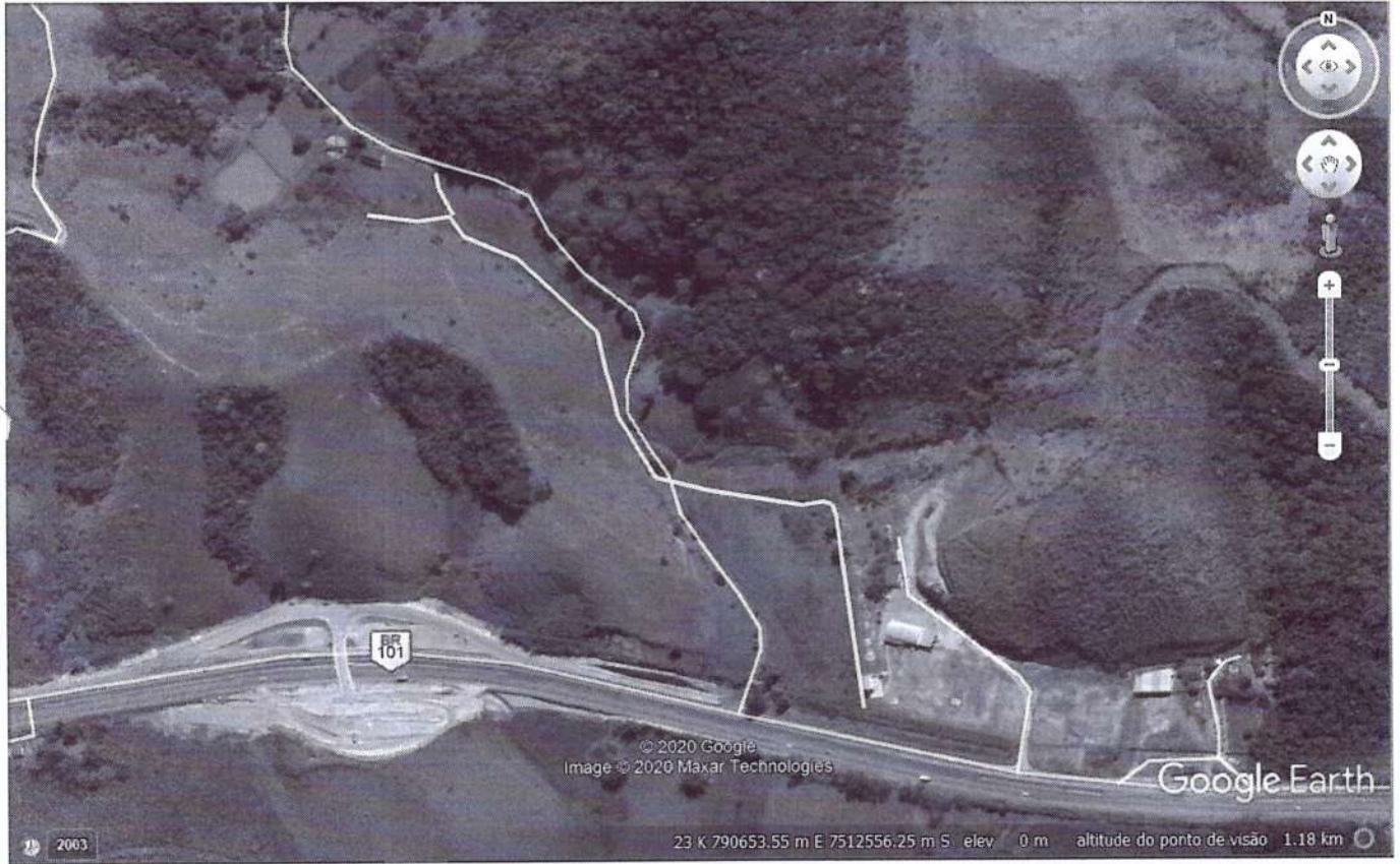
FIGURA 1: Localização do corpo hídrico a ser desobstruído e desassoreado.