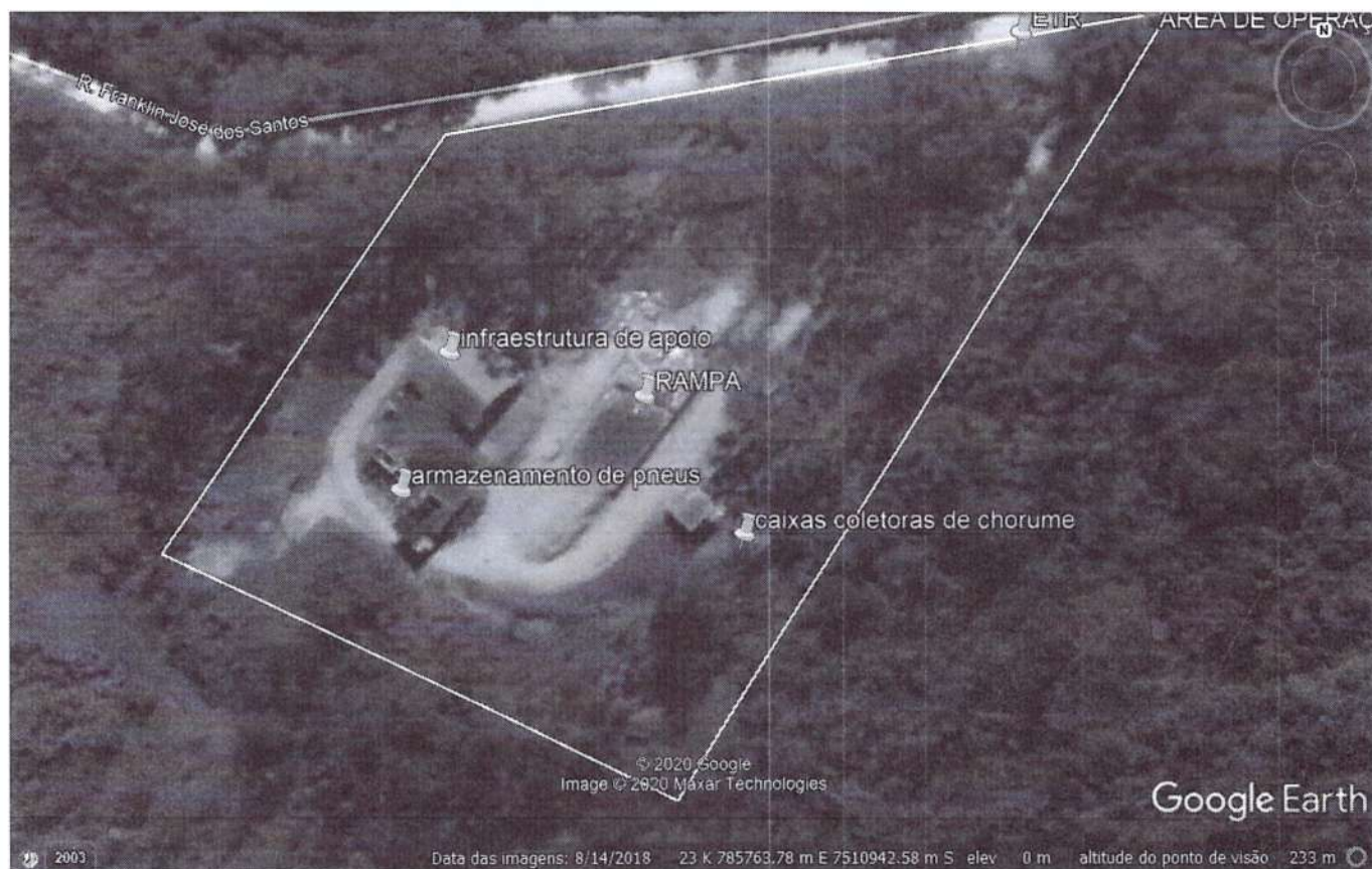
Figura 3: Descrição da Área de operação.