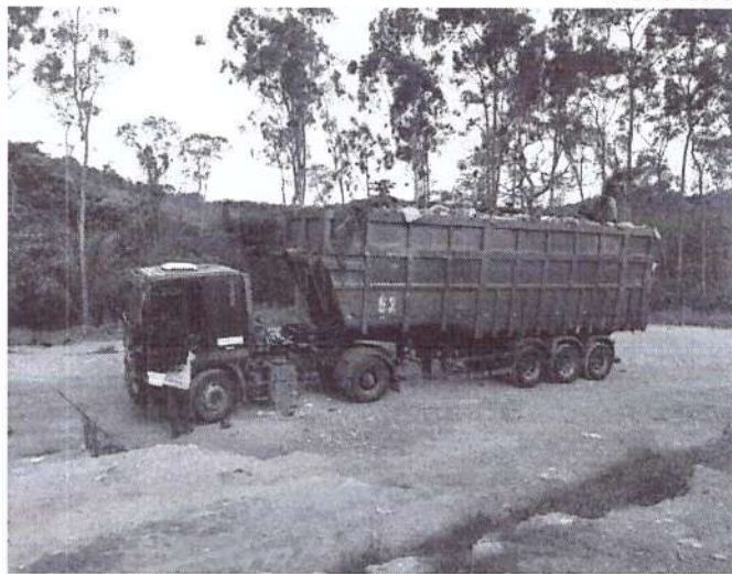
Veículo utilizado para transporte para o aterro.