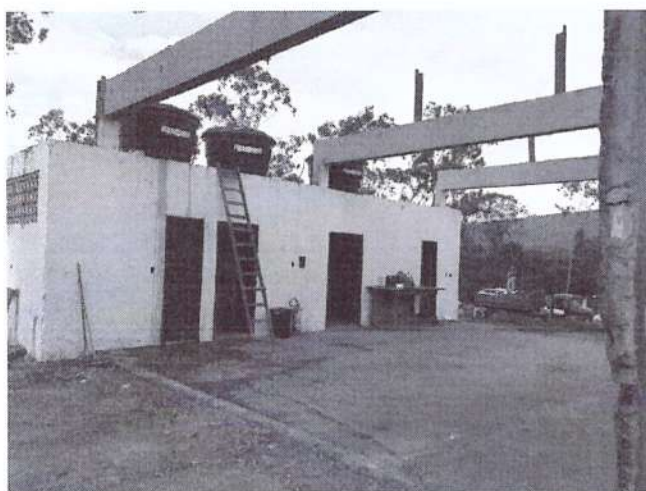
Área de infraestruturas de apoio. (Reforma em andamento)