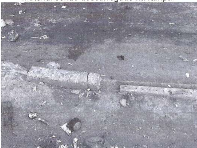
Barreira de proteção da rampa danificada. Reforma prevista.