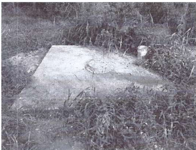
Caixa coletora de chorume