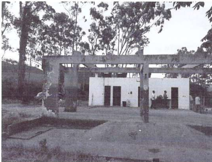
Área de infraestruturas, parte coberta que vai receber novo telhado. (Reforma em andamento)