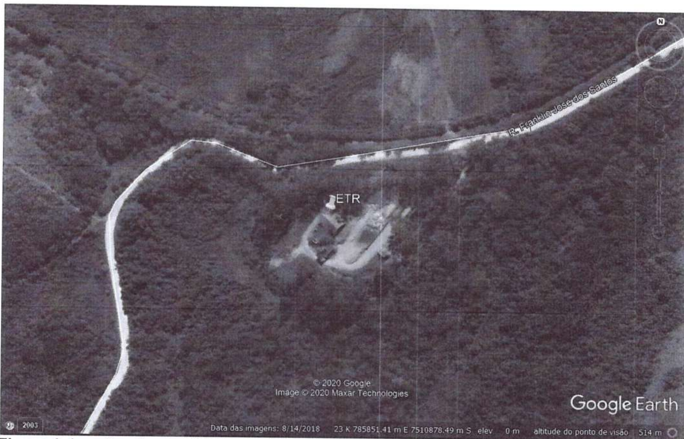
Figura 1: Localização da ETR de Casimiro de Abreu – RJ.