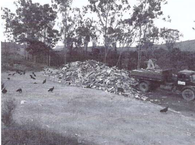
Material sendo descarregado na rampa.