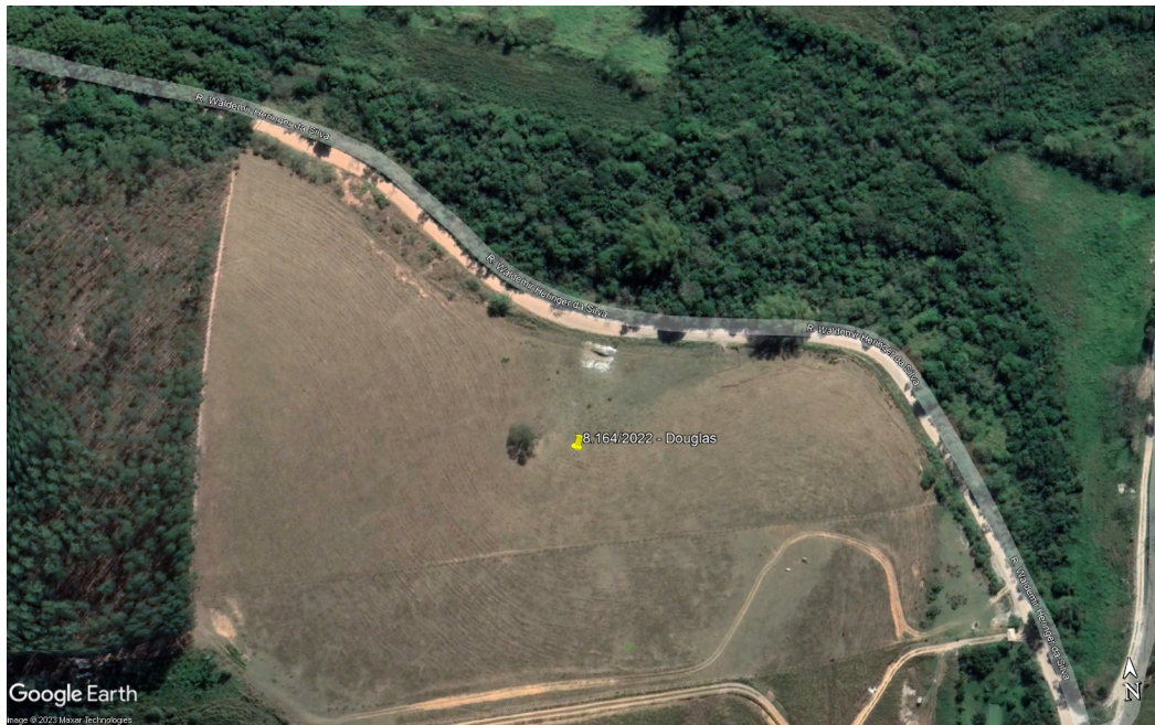
Imagem 1: Localização da propriedade marcada com auxílio do Google Earth.

Trata-se de requerimento de Autorização Ambiental para ligação de energia elétrica em área rural, na Estrada da Ipuca. Está georreferenciado pelas coordenadas UTM 23K 790453.33 m E 7510791.79 m S.