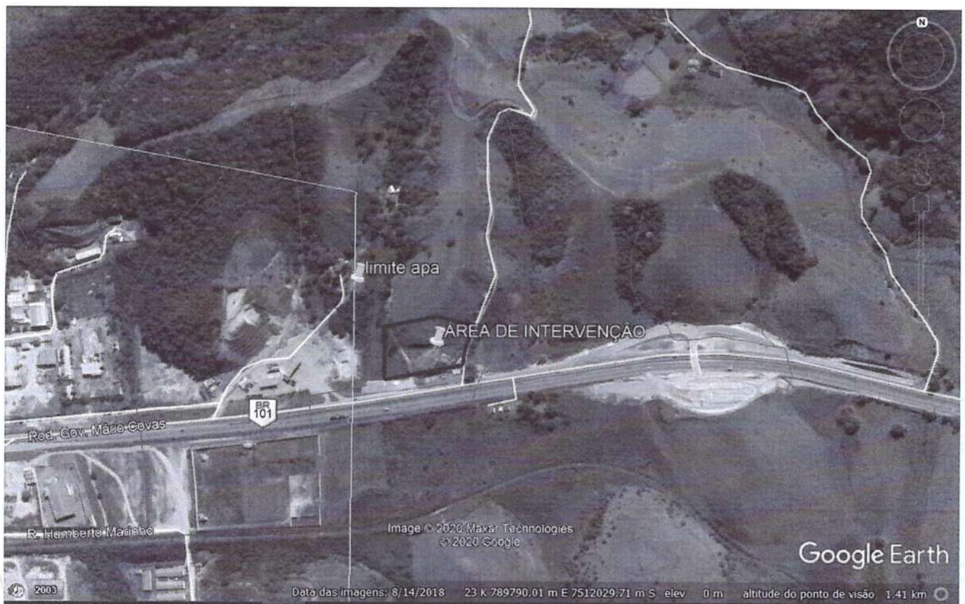
FIGURA 1: Localização da área de intervenção.

A seguir é apresentado uma tabela (TABELA 1) e a Figura 2 com a localização dos vérticos do polígono formado da área de corte (Pontos 1 a 5) e área de aterro (Pontos 6 a 8) sendo o aterro adjacente à estrada existente até o início da área de APP.