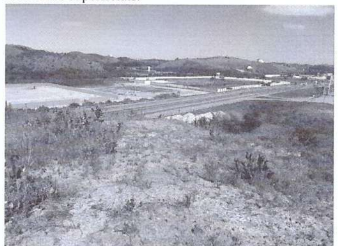
Figura 3: Registro da vistoria em 22/07/2020.

l) Parte superior do morro a sofrer o corte. Sem horizontes superficiais.