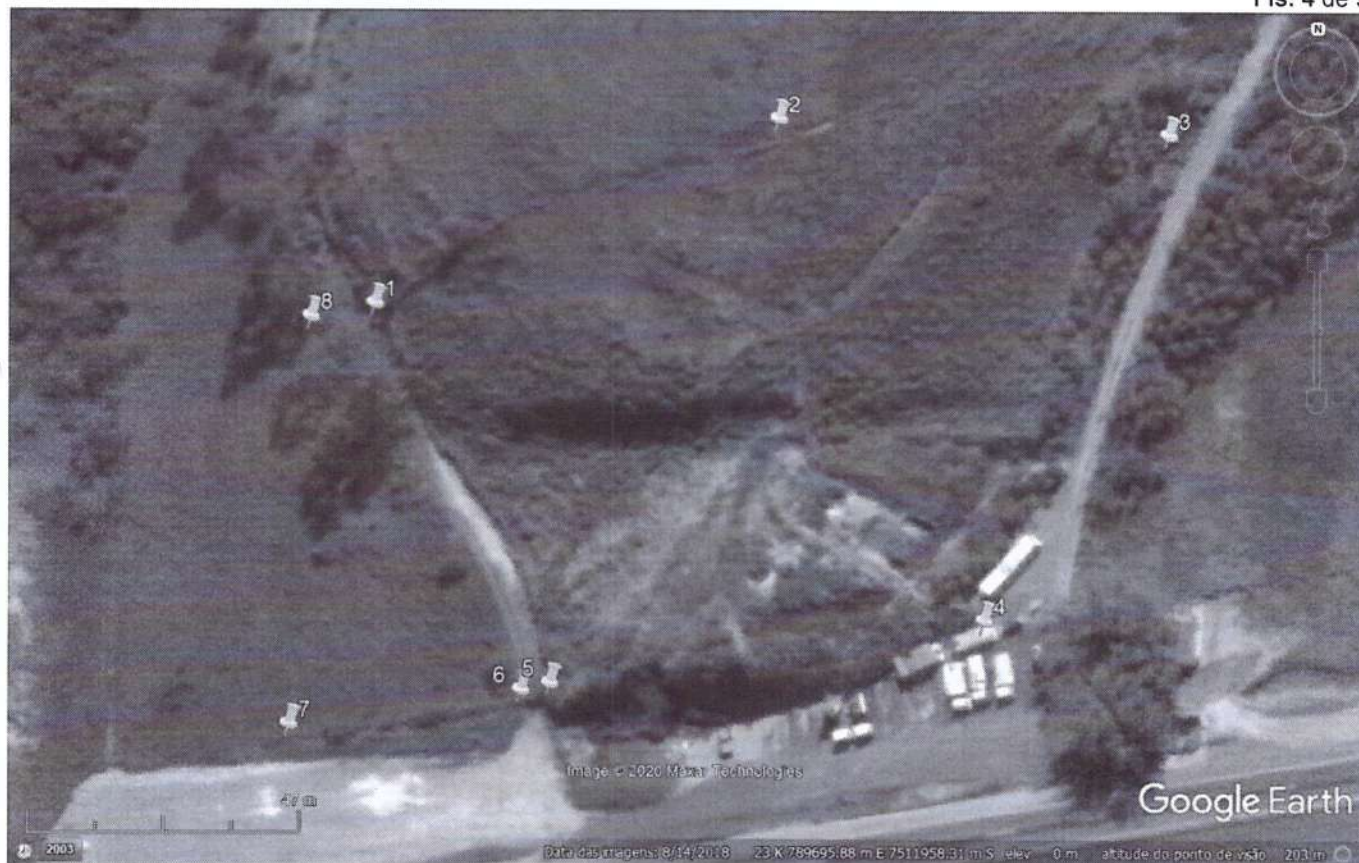
FIGURA 2: Delimitação da área de desmorte (1 a 5) e área de aterro.