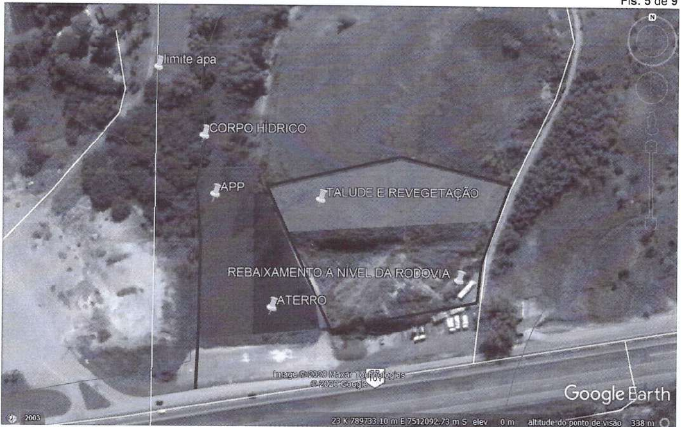
Figura 3: Vista aérea da área a ser Implantada a atividade.

A área a sofrer intervenção está inserida dentro dos limites da APA da Bacia do Rio São João/Mico-leão- dourado.