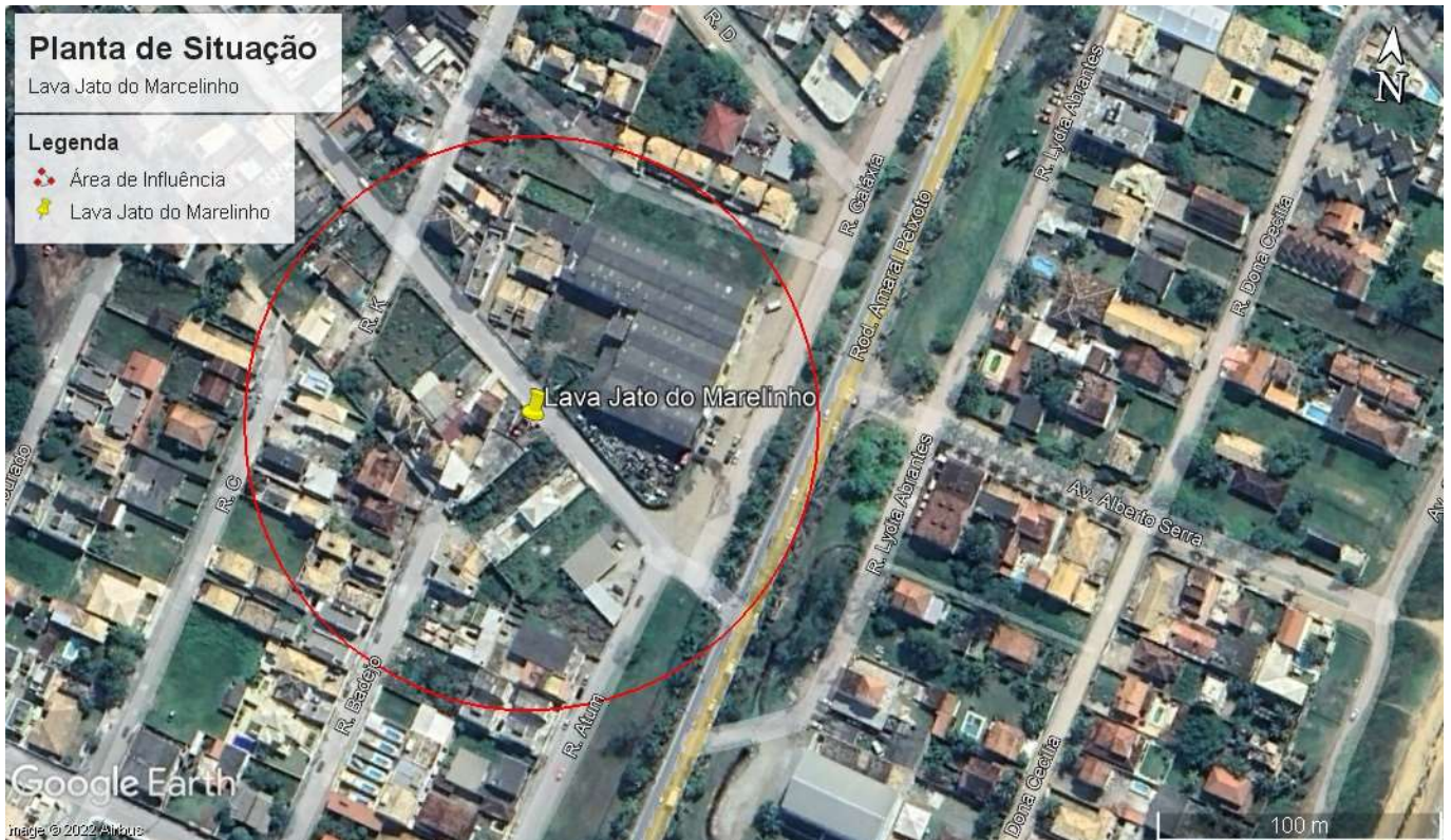
Imagem 1: Localização do empreendimento, imagem obtida pelo Programa Google Earth .