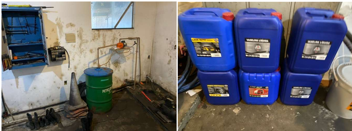
Imagem 8: Depósito de Material e Casa de Máquinas