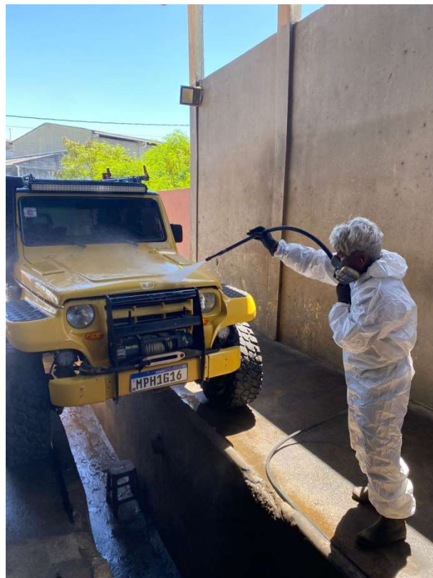
Imagem 5: Rampa de Lavagem