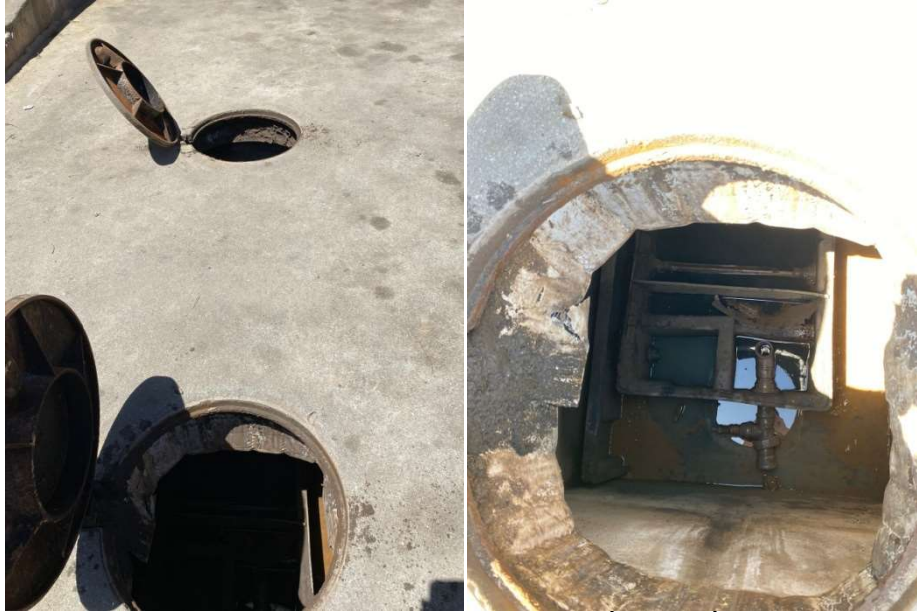
Imagem 4: Caixa Separadora de Água e Óleo