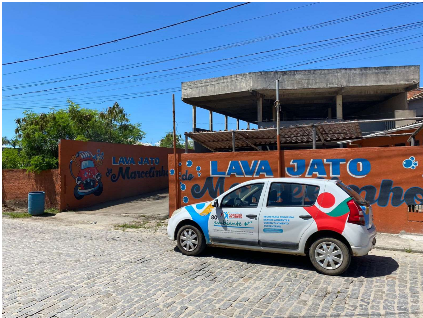
Imagem 1: Vista frontal do empreendimento