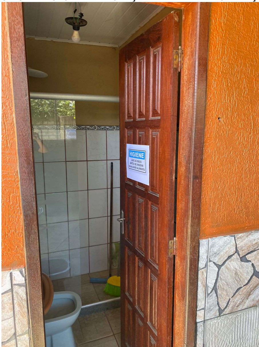
Imagem 3: Banheiro