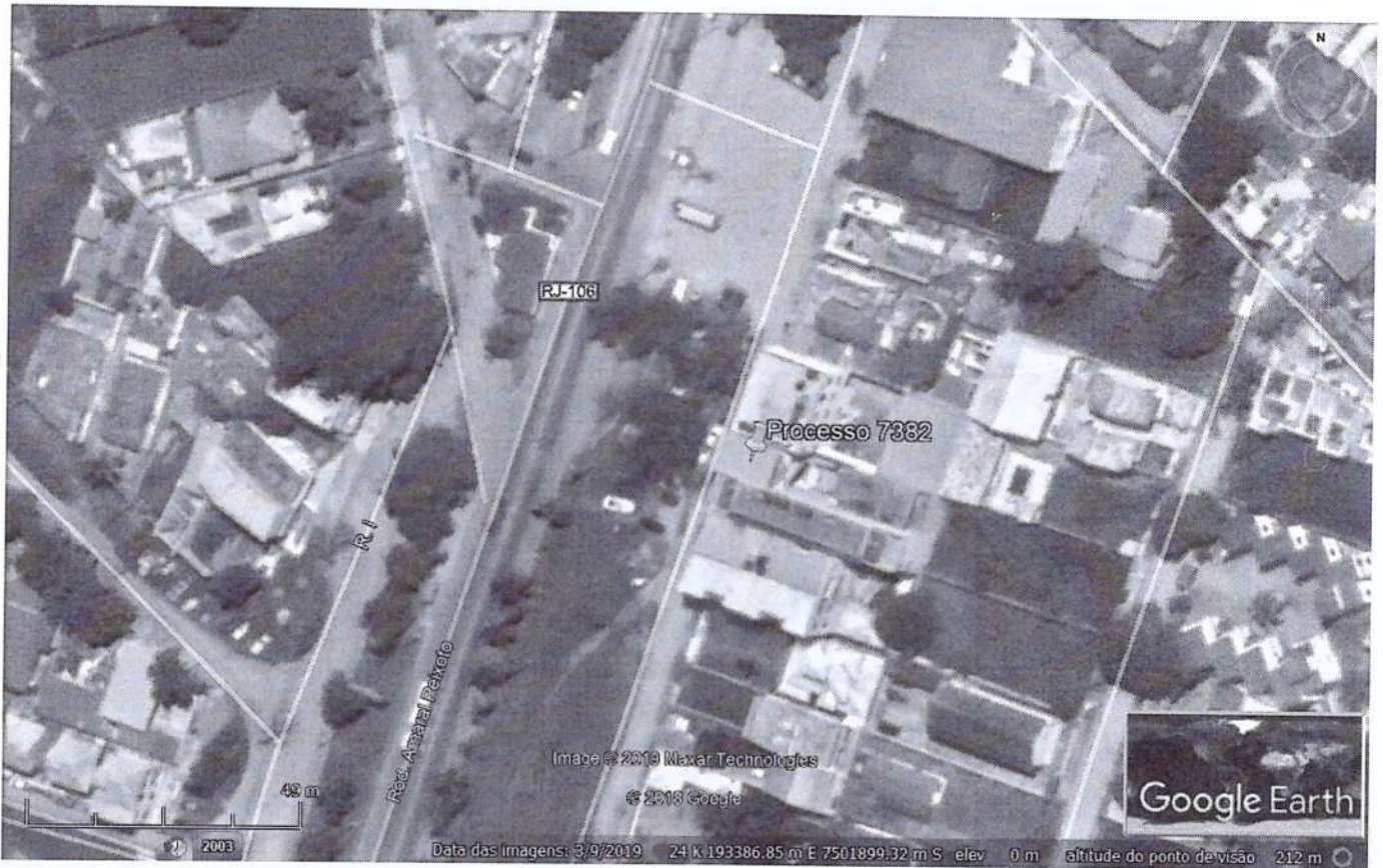
Figura 1: Localização do empreendimento.