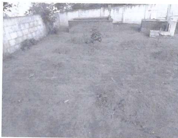
Covas abaixo do nível do solo com identificação e delimitação precária.