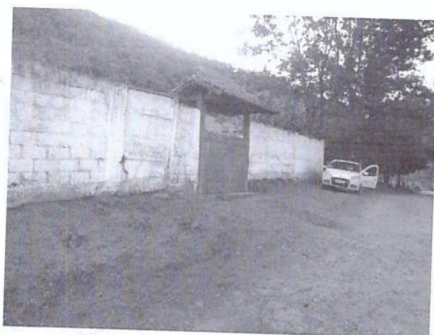
Vista da área externa do cemitério.