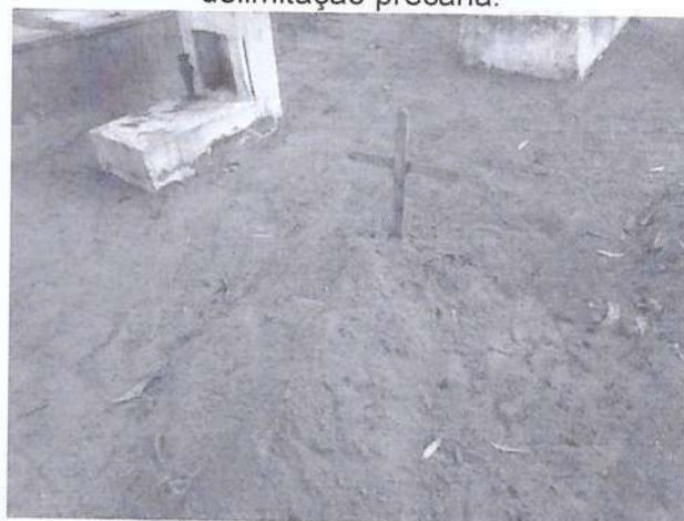
Covas abaixo do nível do solo com identificação e delimitação precária.