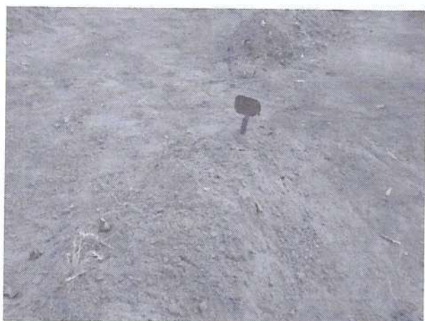
Covas abaixo do nível do solo com identificação e delimitação precária.