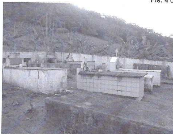
Área com jazigos acima do solo.