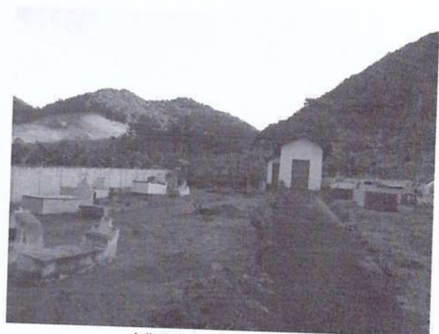
Vista da área interna.