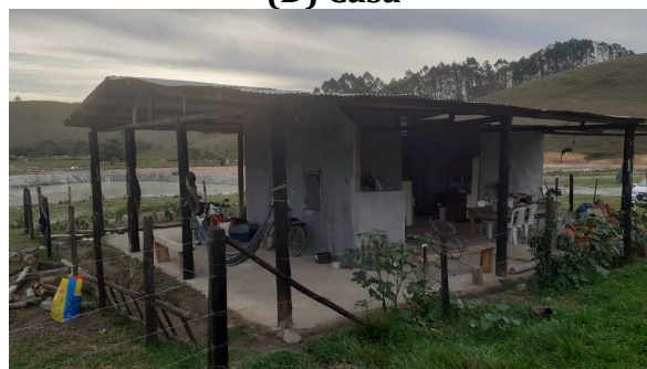
FIGURA 02: Registro da Vistoria.