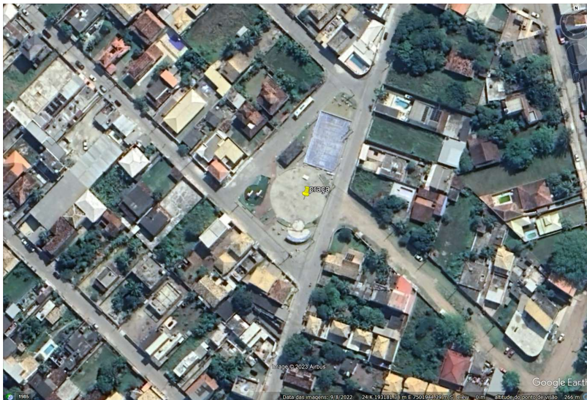
FIGURA 1: Localização da empresa.

A seguir é apresentado o registro fotográfico da vistoria realizada.