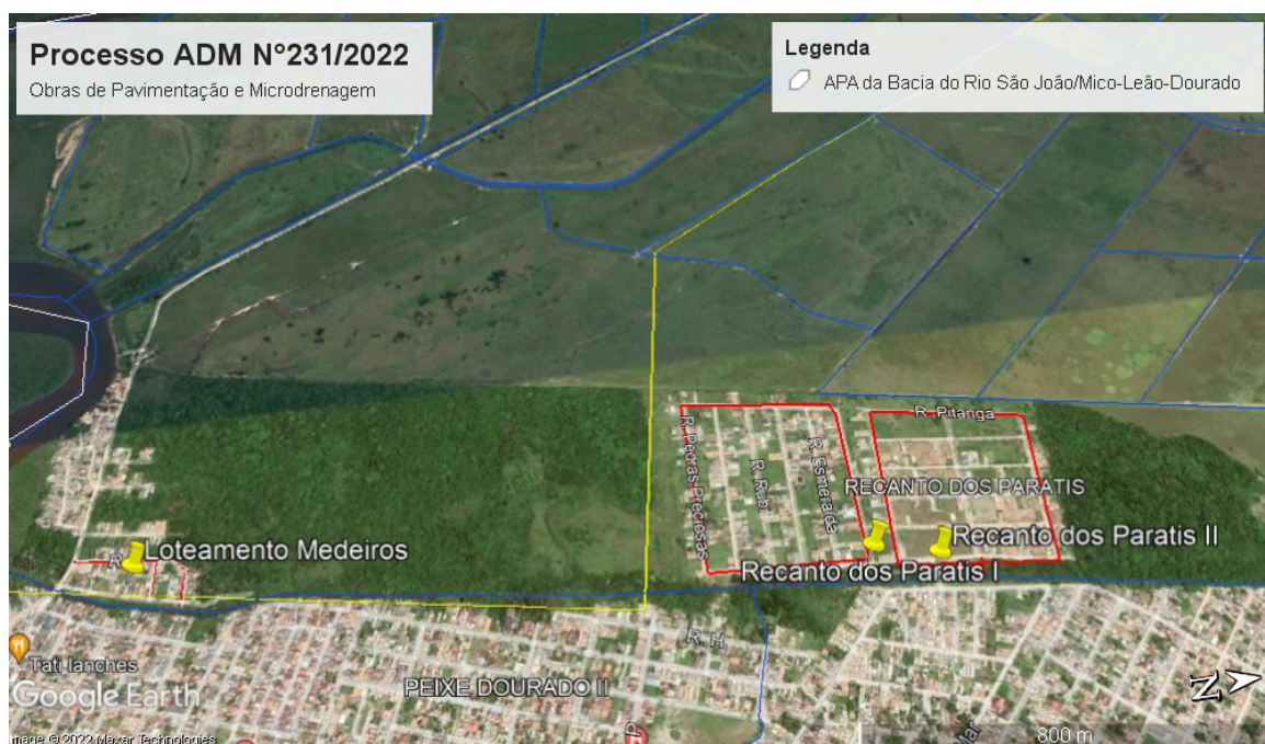
Planta de localização obtida através do Programa Google Earth .

A área de intervenção encontra-se fora dos limites da Unidade de Conservação Federal Área de Proteção Ambiental - APA da Bacia do Rio São João/ Mico-Leão-Dourado.