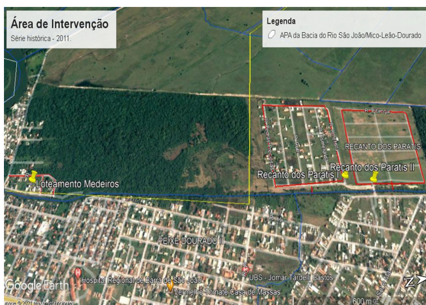
Imagem obtida através do Programa Google Earth da série histórica no ano de 2011.