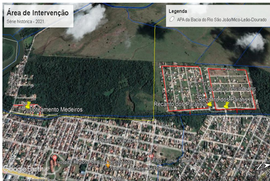
Imagem obtida através do Programa Google Earth da série histórica no ano de 2021.

Através do Programa Google Earth , foi possível observarmos o entorno das áreas de intervenções, demais circunvizinhanças e o histórico de imagens anteriores, mostrando o restabelecimento da vegetação existente no local.