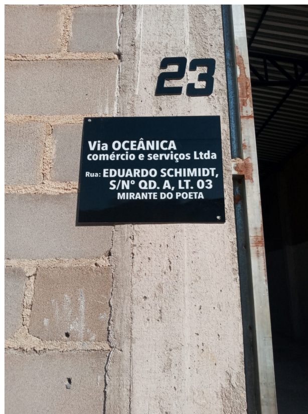
Imagem 2: Placa com endereço do empreendimento para melhor localização.