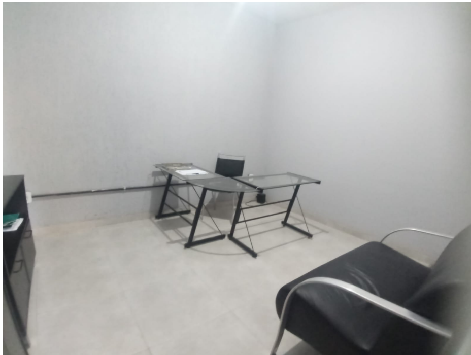
Imagem 6: Vista da área administrativa.