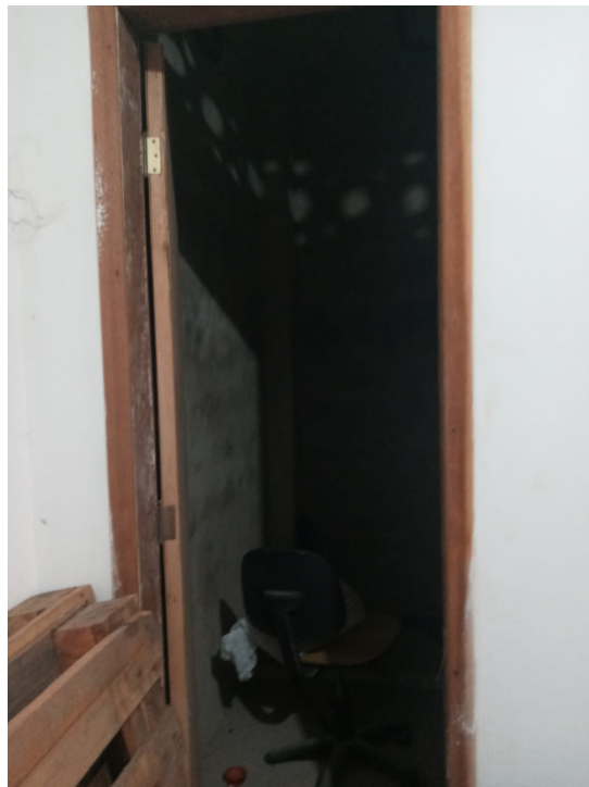
Imagem 7: Vista do depósito.