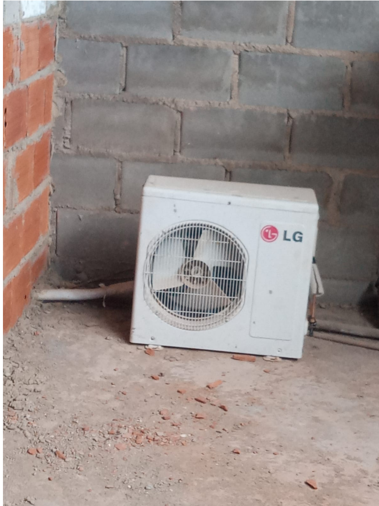
Imagem 8: Área de Operação / Equipamento para manutenção.

MARIELLE GRATIVOL Assessor Especial 2 Matrícula: 14.873