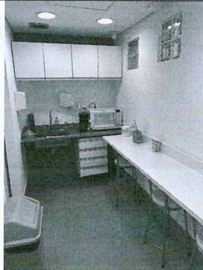
Imagem 7: Copa.