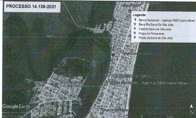
Imagem 1: Imagem de localização obtida através do Programa Google Earth.