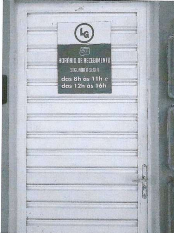
Imagem 6: Placa informativa com dias e horários de funcionamento.