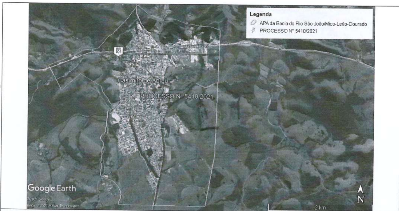
Imagem 1: Imagem de localização obtida através do Programa Google Earth.