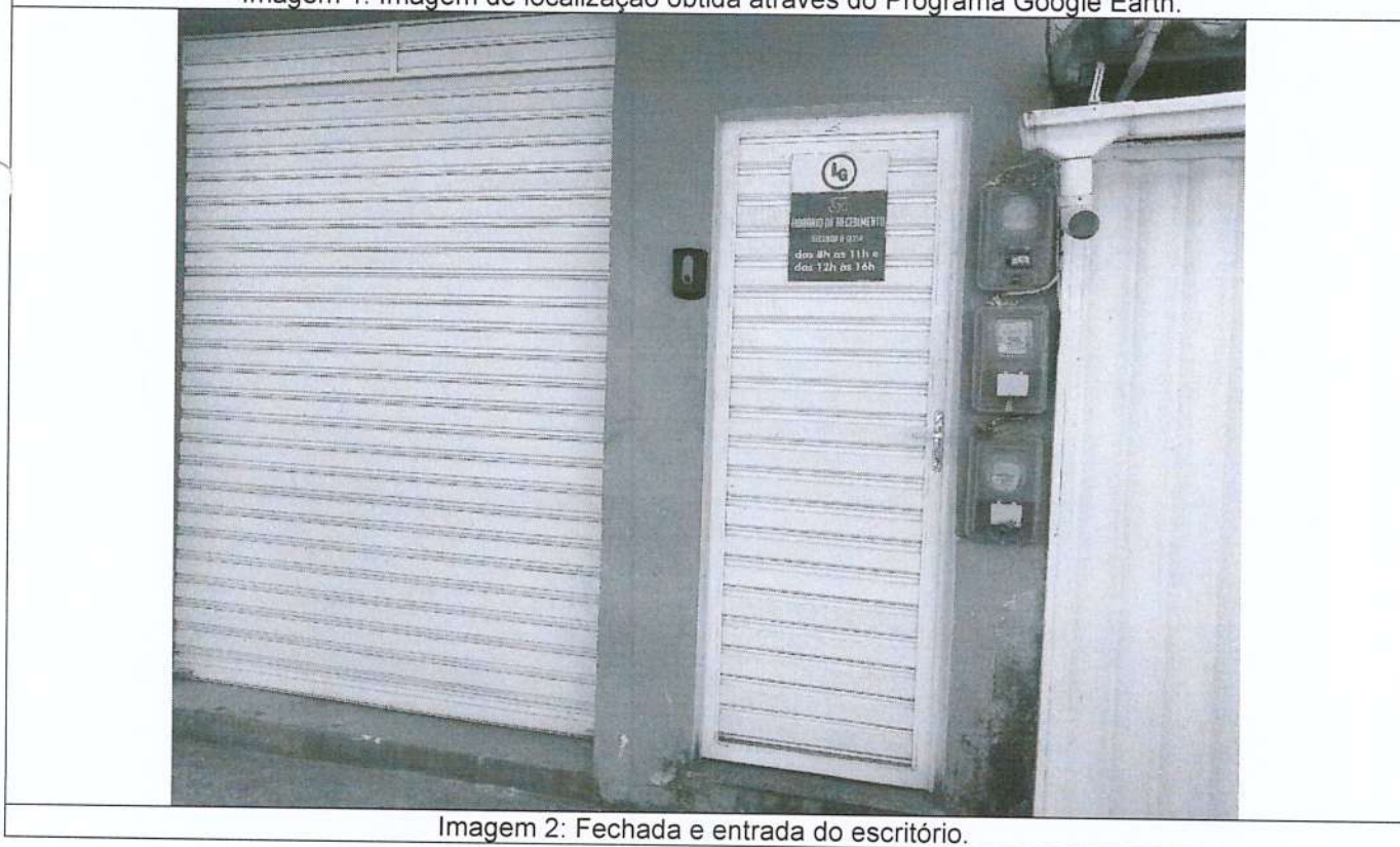
Imagem 2: Fechada e entrada do escritório.