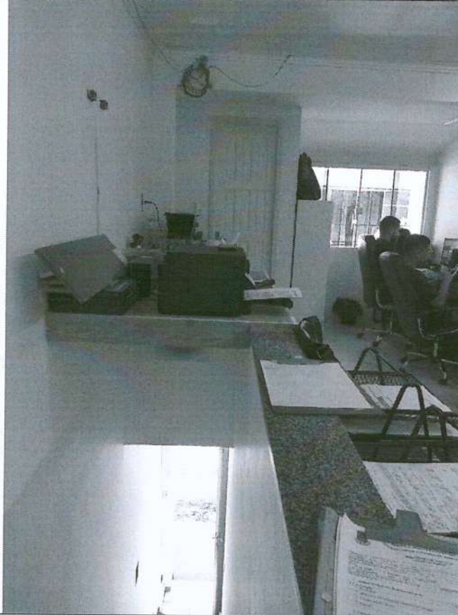
Imagem 5: Acesso ao banheiro para uso dos funcionários.