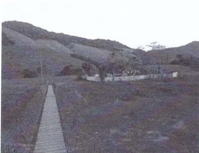
Vista do Cemitério.