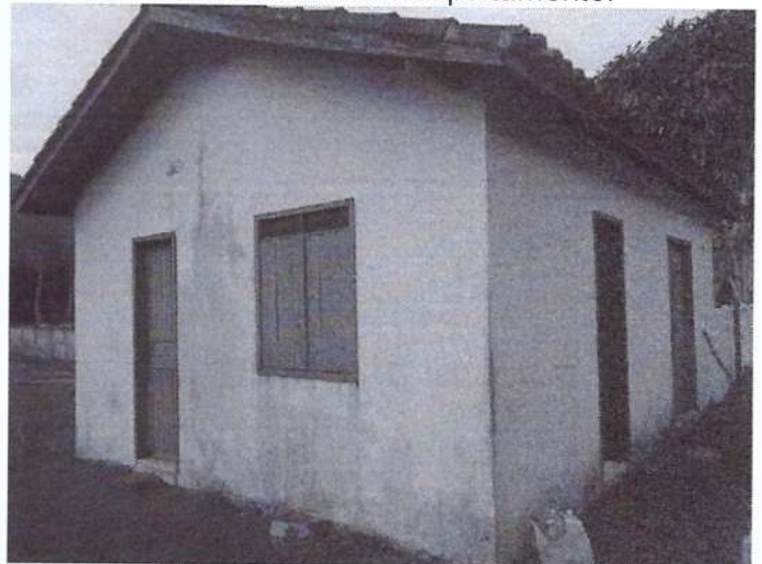
Almoxarifado, banheiro e cozinha.