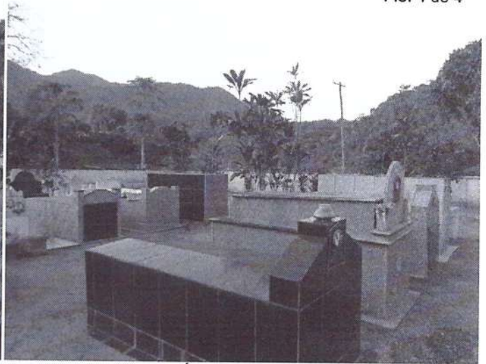
Detalhe da Área de sepultamento.